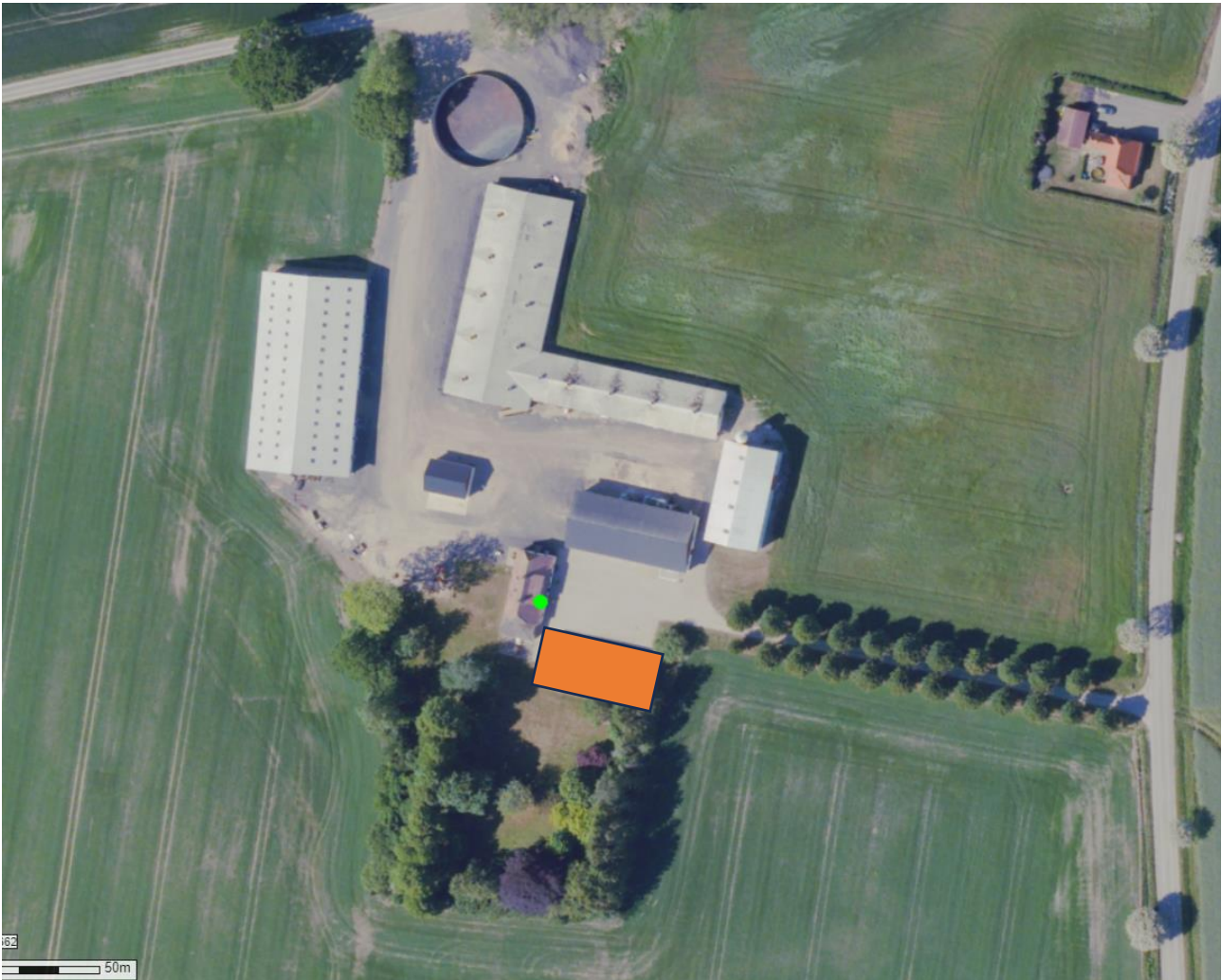
Figur 2: Oversigt over husdyrbruget. Det nye maskinhus er markeret med orange.