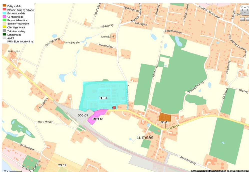
Figur 3, Kort der viser lokalplanområdet 2E.03 (angivet med turkis på kortet).

Fabrikken ligger i udkanten af landsbyen Lumsås. Rammebestemmelsen for landsbyen fastsætter anvendelsen til blandede bolig- og erhvervsformål samt offentlige formål.