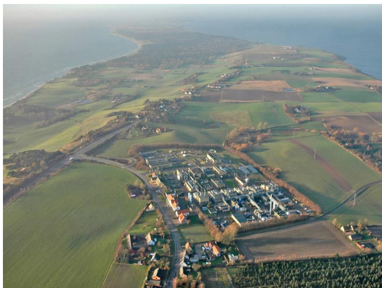
Figur 1, Luftfoto, der viser beliggenheden af H. Lundbeck A/S, Lumsås (2006)

Virksomhedens adresse er Oddenvej 182, Lumsås, 4500 Nykøbing Sj. Virksomheden er beliggende på matr. Nr. 7o, Lumsås by, Højby, Trundholm Kommune. Arealet er i byzone.