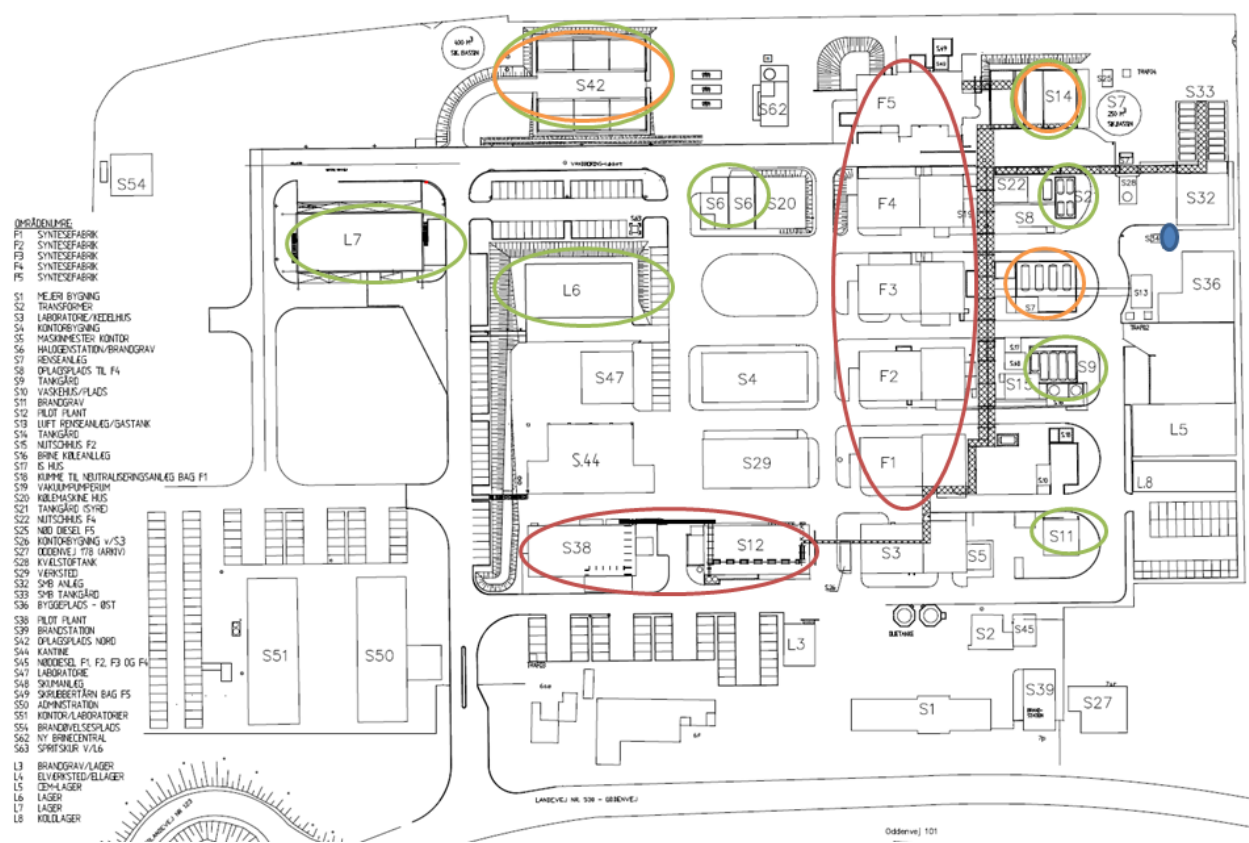
Figur 4, Kort der viser placering af bygninger og andre dele af virksomheden. Røde cirkler = syntesefabrikker, Pilot Plant og Kilolab, grønne cirkler = lagerfaciliteter, orange cirkler = oplag af affald, blå prik = skorsten til luftfaskst.

På tegningen herunder (figur 4) er placering af bygninger og andre dele af virksomheden angivet. Forsøgsproduktionen finder sted i en af eksisterende syntesefabrikker F1-F5, Pilot Plant og Kilolaboratorie (disse lokaliteter er angivet med rød cirkel på figur 4). Primære lagerfaciliteter er angivet med grønne cirkler, mens opbevaring af affald er angivet med orange cirkler på figur 4. Flere eller alle af disse anvendes i den pågældende forsøgsproduktion. Placering af 30 meter skorsten (se beskrivelse i afsnit H "Beskrivelse af valgte rensemetoder generelt") er angivet på figur 4 med blå prik.