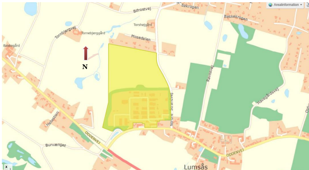
Figur 2, Kort der viser matrikel 70, H. Lundbeck A/S, Lumsås (målestok 1:6.000).