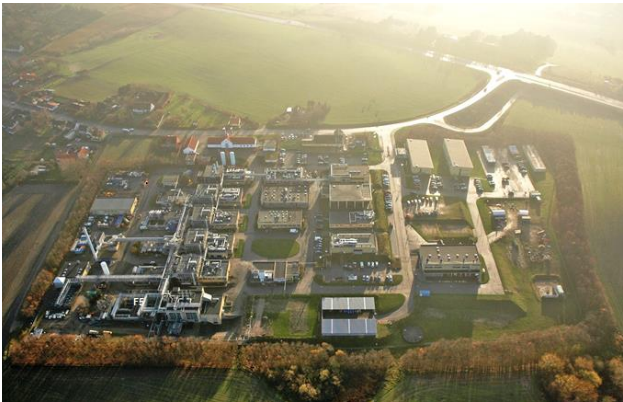
Figur 5, Luftfoto fra 2006 der viser placeringer af bygninger og andre dele af virksomheden. Billedet er taget fra nord mod syd.