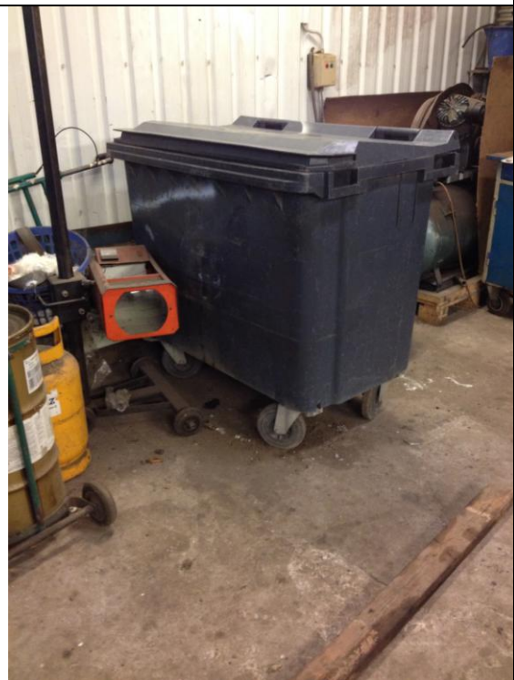
Foto 4 600 l vip container til småt brændbart