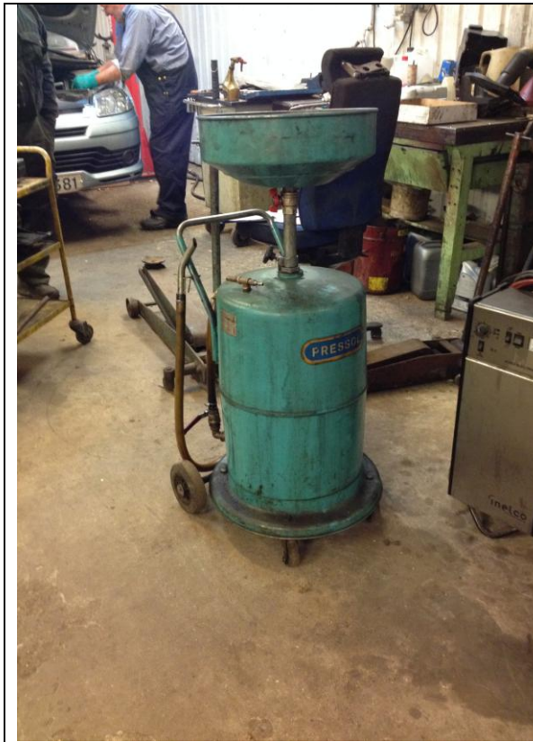
Foto 5 beholder til opsamling af olie mv.