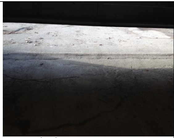
Foto 2 af opkant v. porten