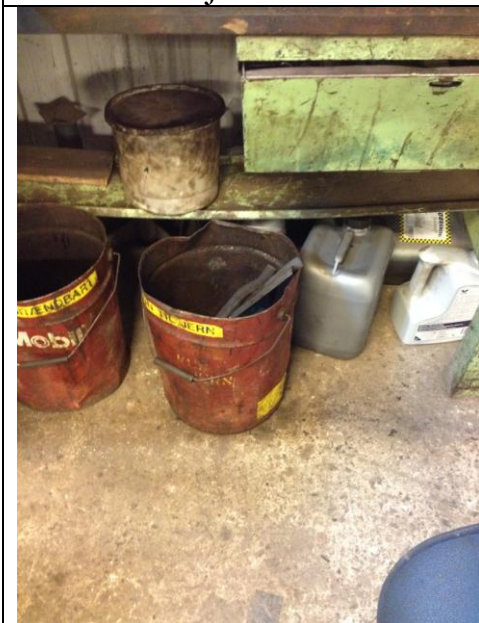
Foto 3 10 l spand til metal affald