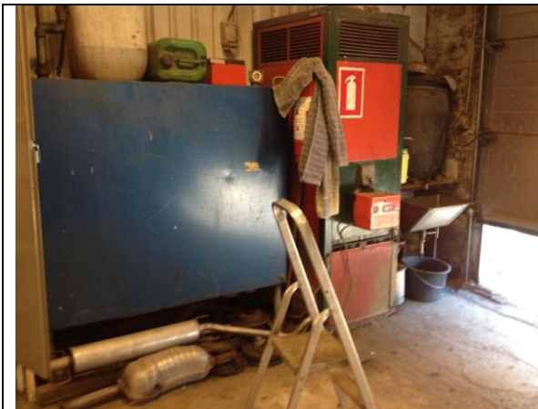
Foto 1 af overjordisk olietank til oliefyr