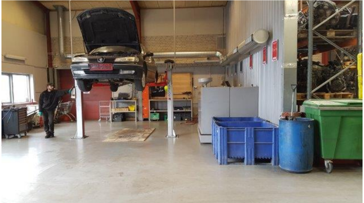
Figur 2 - Området hvor miljøbehandling foretages. De grå tanke er til spildolie, den ene er reserve. De står henover to spildbakker som hver især ikke kan rumme tankens indhold.