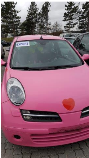
Figur 1 - Mærkning af biler er meget tydelig.