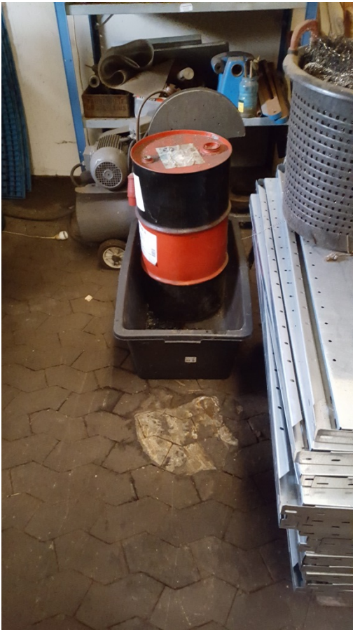
Foto: Korrekt opbevaring af olieaffald i tønde i kasse.