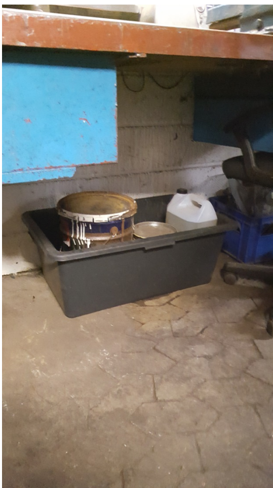
Foto: Korrekt opbevaring i kasse

Af nedenstående fotos fremgår det, at indskærpelsen er efterkommet og sagen kan derfor afsluttes uden yderligere bemærkninger.