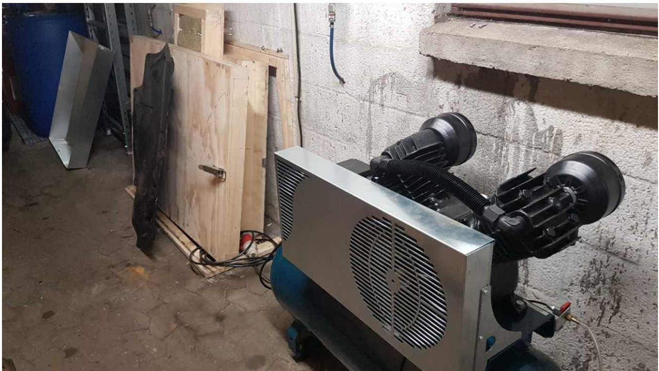
Nyindkøbt kompressor placeret indendørs. Støjhuset (tv) etableres udenom kompressoren.