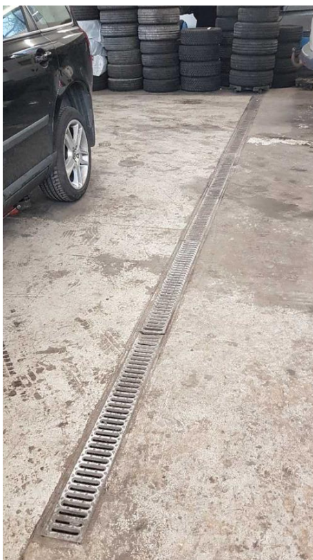
Afløbsrende på værkstedet.