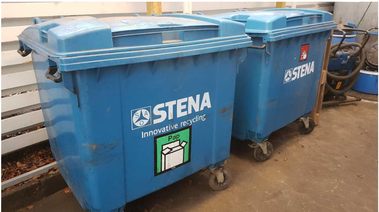
Containere til pap samt brændbart erhvervsaffald.