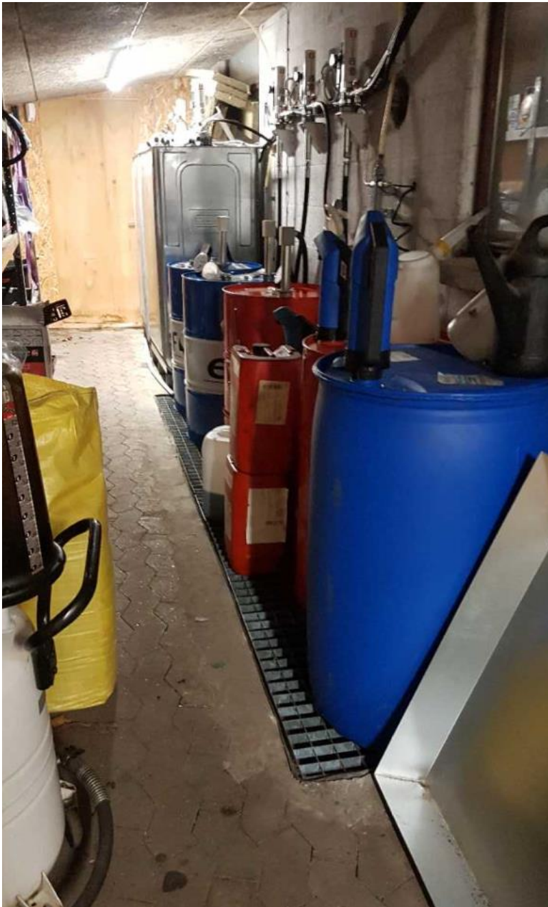
Råvarer står over opsamlingsump og motorolie i to dobbeltvægge tanke.