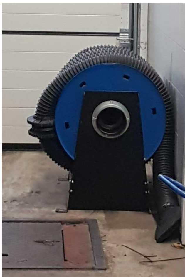
Slangerulle til udsugning er købt.