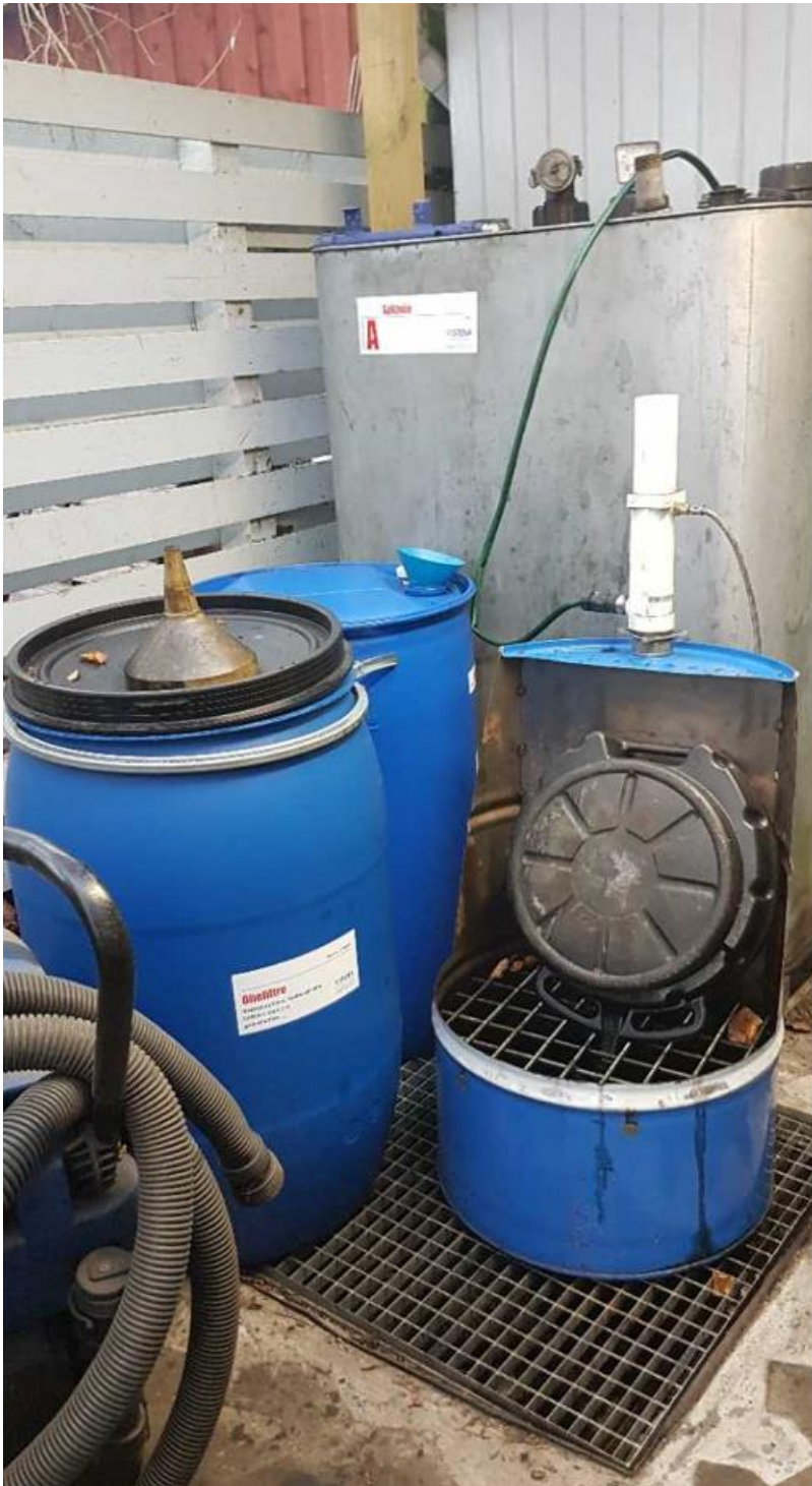
Spildolie i tank med dobbeltvæg og øvrigt farligt affald over opsamlingssump.