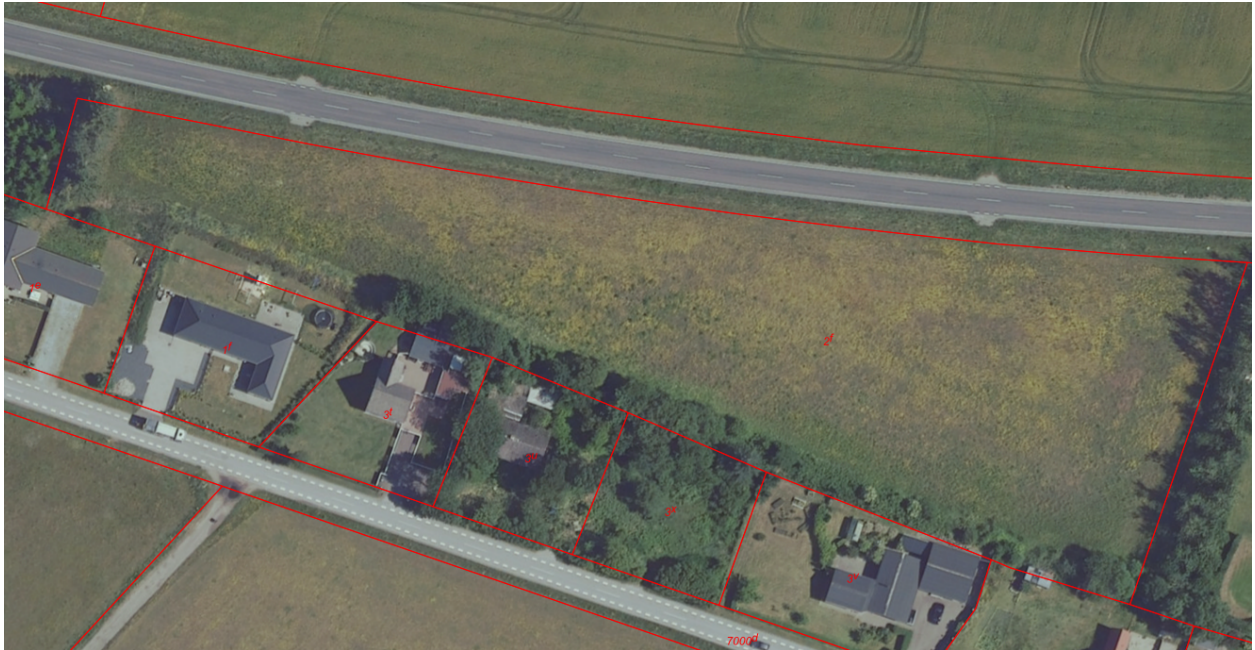
Billede 1. Kortudsnit af mellemdepot ved Hjallerup (matr nr. 2f, Ejerlav: Sdr. Ravnstrup, Ørum)

Brønderslev Kommune har den 6. december 2022, modtaget ansøgning om miljøgodkendelse af midlertidigt mellemdepot på Tylstrupvej ved Hjallerup. Se nedenstående kortudsnit.