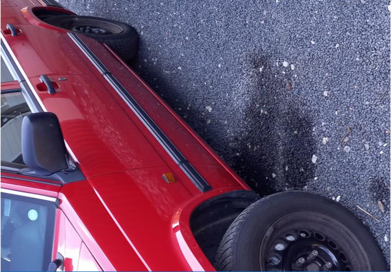
Billede 4. Lækage fra bil på autoværkstedets grusareal.

Derudover blev der på tilsynet observeret to tromler fyldt med motorolie på virksomhedens græsareal. Det vurderes at de udgør en risiko i forhold til jord- og grundvandsforurening, da eventuelle lækager kan sive ud og forurene det omkringliggende miljø.