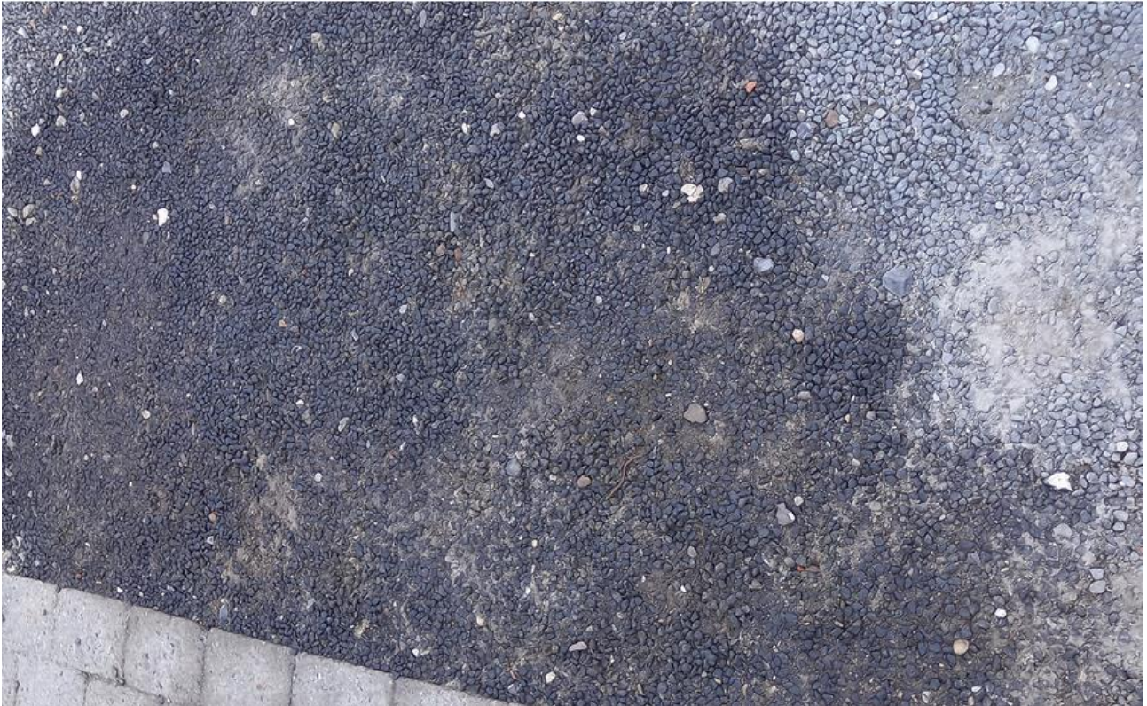
Billede 3. Et større spild autoværkstedets grusareal efter en eksploderet køler

Ved tilsynet blev der observeret to spild på autoværkstedets grus parkeringsplads. Det ene af de to spild skete en engangshændelse, hvor en køler eksploderede (se billede 3), og det andet spild kom fra en bil, som lækkede væske (se billede 4).