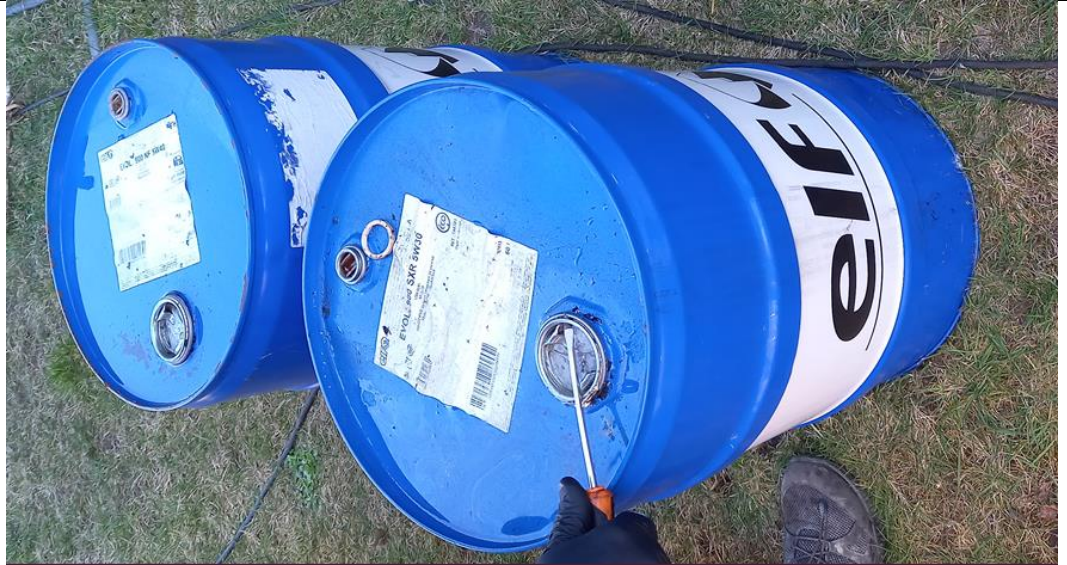
Billede 2. De to 60 liters tromler

Ved tilsynet lå der større mængder af byggeaffald på matriklen. Det blev oplyst at det stammede fra naboejendommen, hvor der er et byggeri i gang.