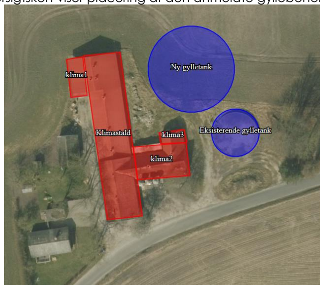
Figur 1: Oversigtskort over staldanlæg og placering af ny gyllebeholder

Nedenstående oversigtskort viser placering af den anmeldte gyllebeholder: