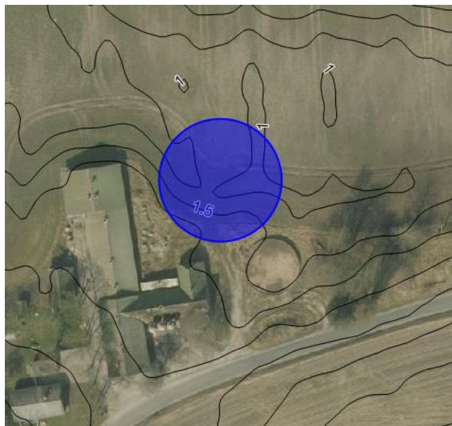
Figur 2: Terrænhældninger på den anmeldte placering

Det er ikke nødvendigt at ændre væsentligt i det eksisterende terræn ved etablering af gyllebeholderen. Som det fremgår af nedenstående luffoto, er terrænet jævnt på den anmeldte placering.