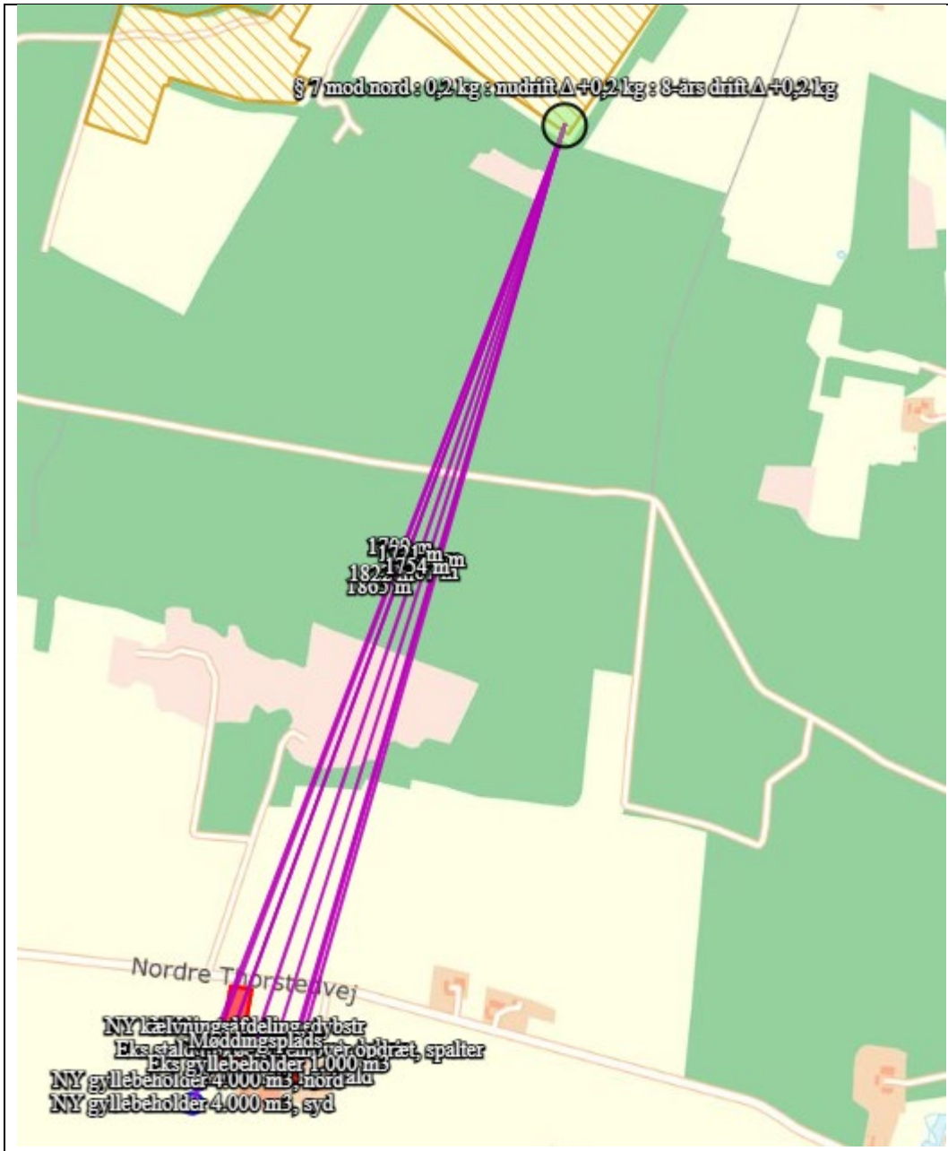
Nærmeste kategori 2-natur

Der er foretaget en ammoniakdepositionsberægning på dette område, som viser, at totaldepositionen fra husdyrbruget er på 0,2 kg NH 3 -N/ha/år. Beskyttelsesniveauet for kategori 2-natur er 1,0 kg NH 3 -N/ha/år. Dermed er kravet til ammoniakdeposition på kategori 2-natur opfyldt.