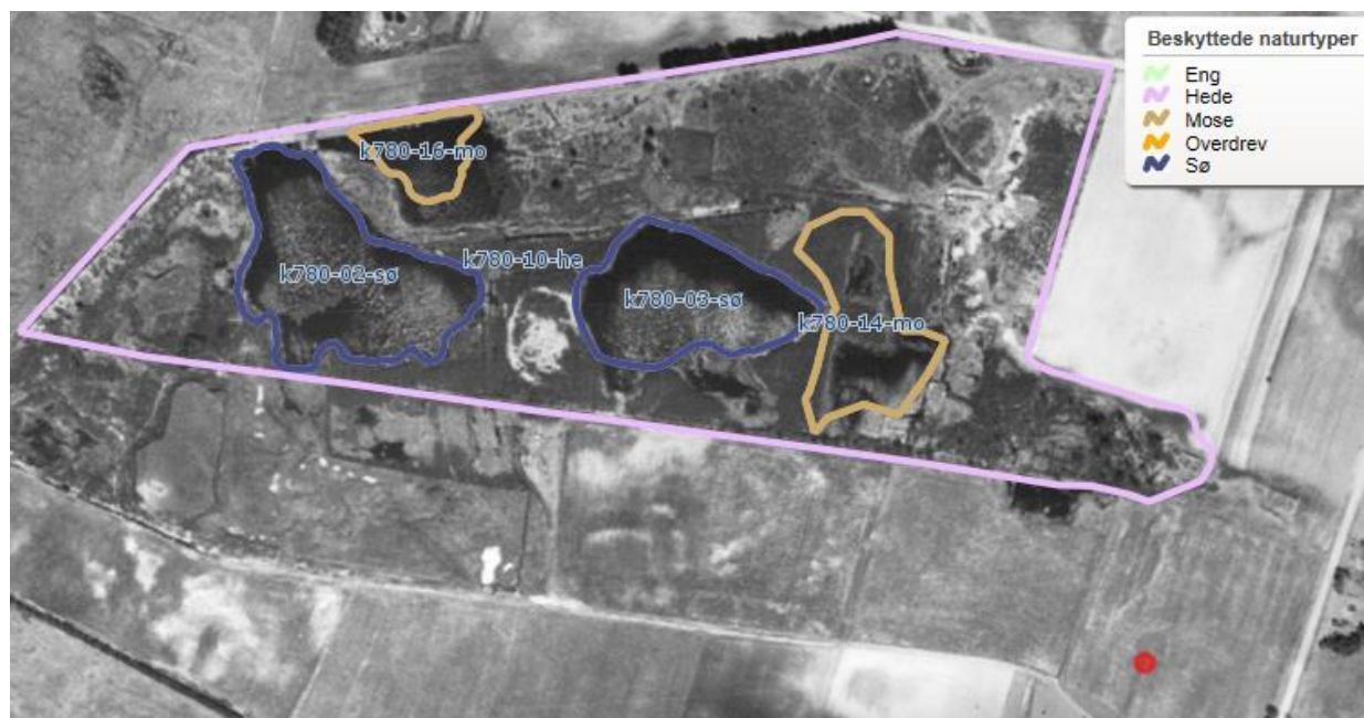
Luftfoto 1954 – Den røde prik er beliggenhed af gyllebeholder.

På luftfotoet fra 1954 ses det tydeligt, at der har været gravet tørv. Nyere luftfotos fra 1966-2016 viser at tørvegravningen er ophørt. Arealerne gror med tiden til i birk m.m. Sørne gror ikke til i birk, og der dannes igen hængesæk af sphagnum mosser og kæruld.