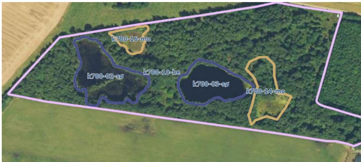
Luftfoto 2015 - Beskyttet natur NV for Malmhøjvej 13. Lyslilla=hede, brun=mose, blå=sø.

Moseområderne k780-14-mo og k780-16-mo er af naturtypen nedbrudt højmose, og den øvrige natur er en mosaik af hede, brunvandede søer og tilgroet tørvemose.