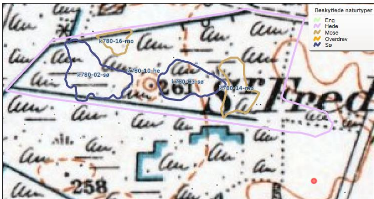
Målebordsblade fra 1928 - 1940 – Den røde prik er beliggenhed af gyllebeholder.

På luftfotoet fra 1954 ses det tydeligt, at der har været gravet tørv. Nyere luftfotos fra 1966-2016 viser at tørvegravningen er ophørt. Arealerne gror med tiden til i birk m.m. Sørne gror ikke til i birk, og der dannes igen hængesæk af sphagnum mosser og kæruld.