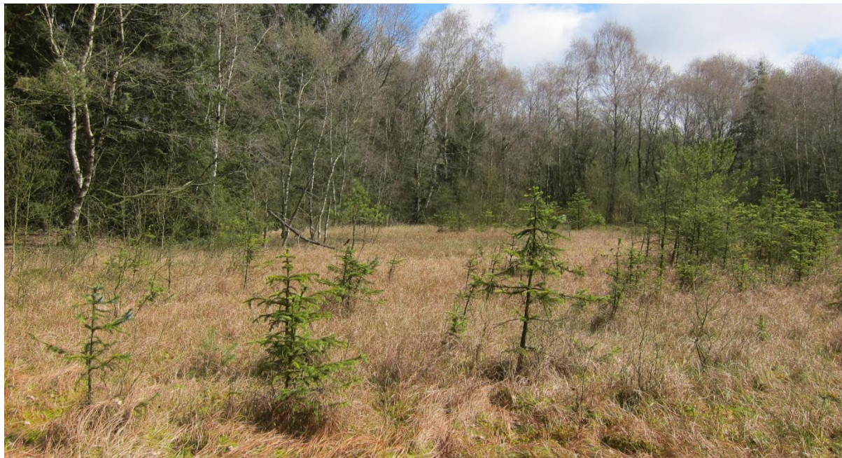
Foto af mose k780-14-mo den 25. april 2017. Centralt i mosen er der hængesæk af sphagnum med kæruld.

I mosen vokser der flere arter af sphagnummosser, smalbladet kæruld, tuekæruld, lysesiv, smalbladet mangeløv, blåtop, tranebær, hedelyng, rosmarinlyng, klokkelyng, jomfruhår m.m. Mosen er under tilgroning af især birk og rødgran.