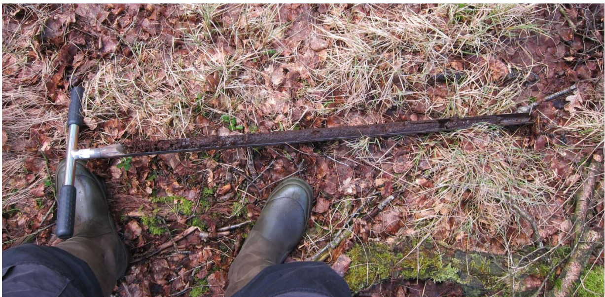
Tørvbor med mere end 1 m tørv. Hovedsagelig delvis omsat højmosetørv. Prøve taget i kanten af mosen k780-14-mo den 25. april 2017.

Den nærmeste særligt kvælstoffølsomme lokalitet med nedbrudt højmose er k780-14-mo. Mosen er i dag dækket af hængesæk af sphagnummosser og kæruld. Det meste af tørvten er gravet af i forrige århundrede, men der er igen hængesæk af sphagnum og aktiv tørvdannelse. Tørvlaget i området omkring hængesækken varierer fra ca. 20-100 cm. Tørvten er her mørk og under omsætning.