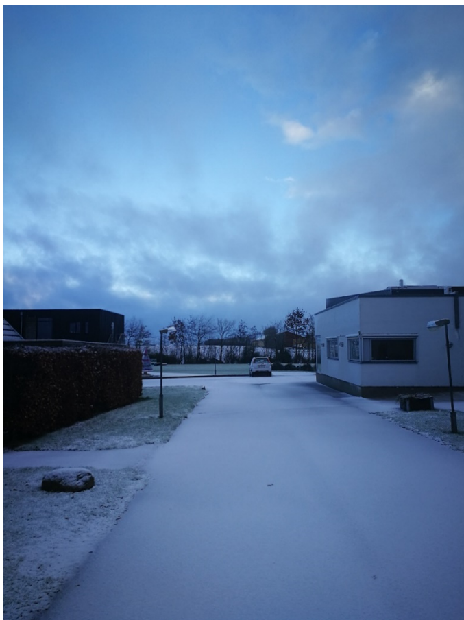
Maskinhuset som siloen placeres ved ses midt i billedet.