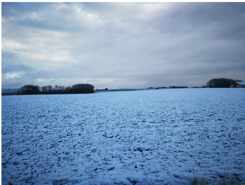
Billede 2: Billede fra vejen ved Overvej 18

Placeringen af siloen sker ved bygningen, til højre i billedet, foran træbevoksningen.