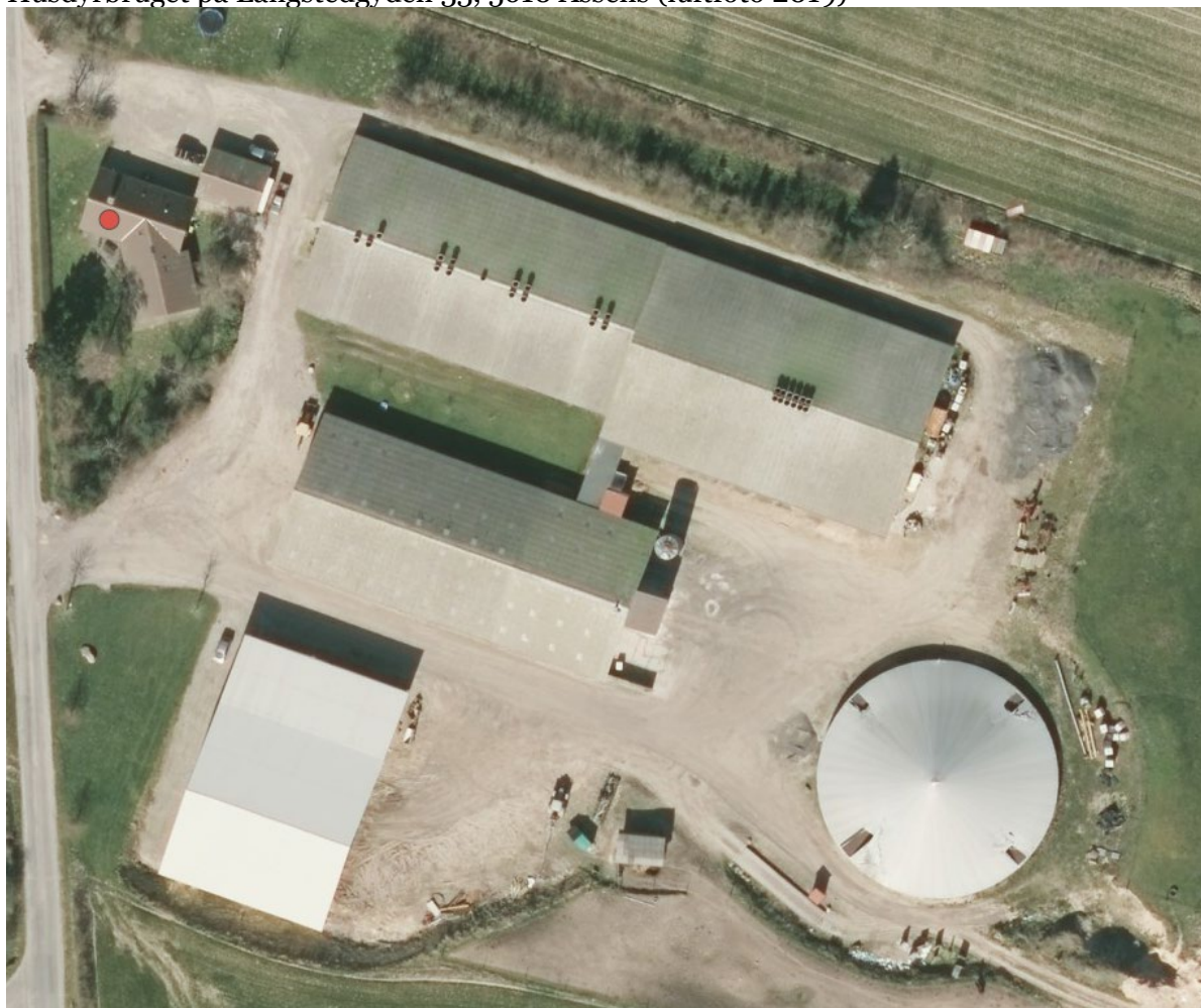
Husdyrbruget på Langstedgyden 33, 5610 Assens (luftfoto 2019)