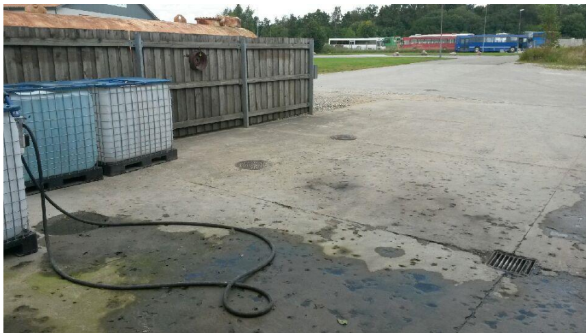
Belægning på udendørs vaskeplads