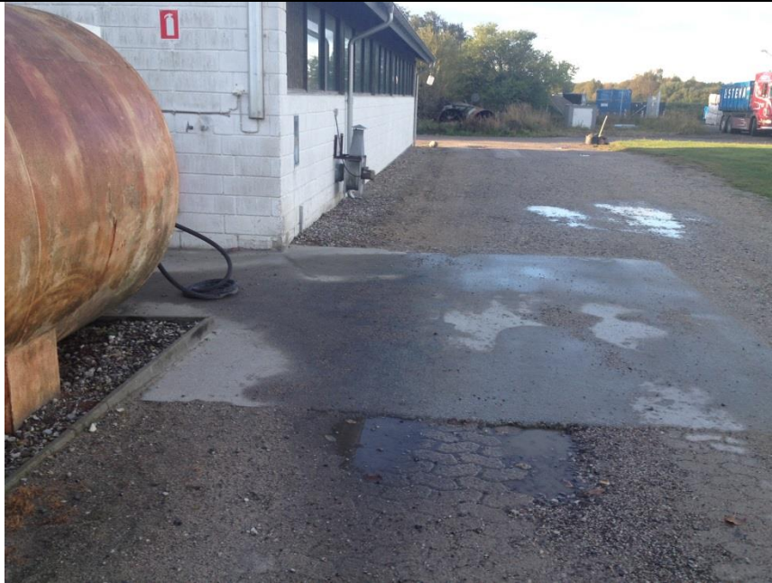
Ny belægning, sandsynligvis med fald ud mod ikke-tæt belægning