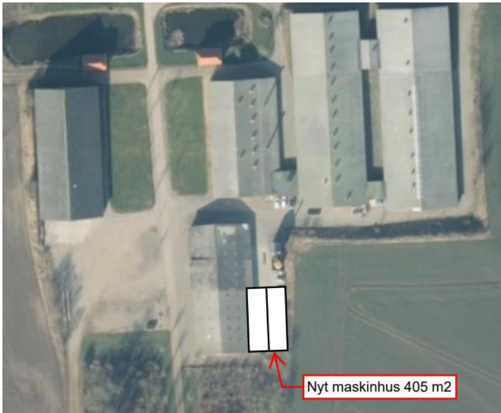
Figur 1: Etablering af nyt maskinhus på Kjeldgårdsvej 9