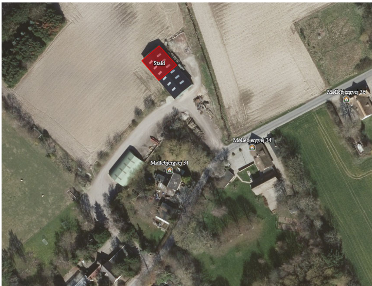
Figur 2. Områdetypen enkeltbolig uden landbrugspligt: Møllebjergvej 31, 34 og 36. De to andre områdetyper: samlet bebyggelse i landzone og byzone ligger længere væk.

Da den faktiske afstand er større end 120 % af geneafstanden, er det ikke relevant at undersøge kumulation med andre husdyrbrug.