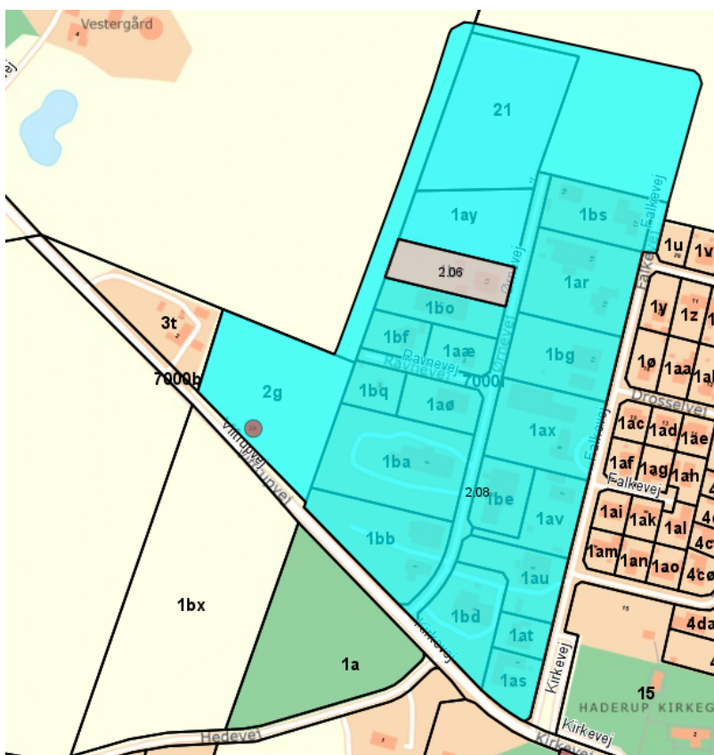
Lokalplan nr. 2.08 for et område til bolig-, erhvervsformål og offentlige anlæg ved Ørnevej og Ravnevej i Haderup