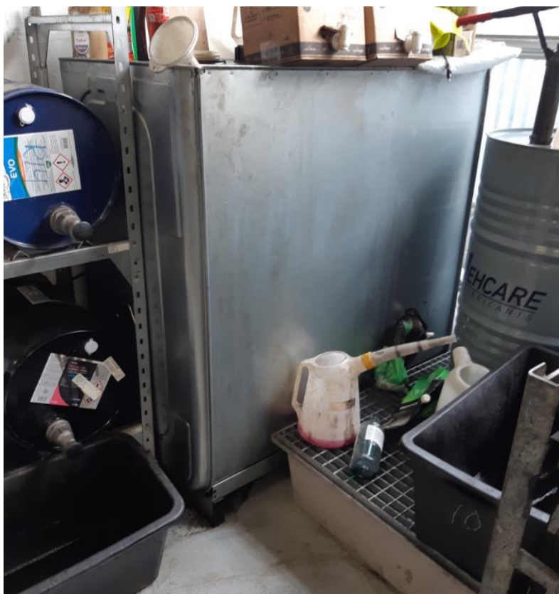
Spildolietank til venstre. Til højre ses spildbakke med stor tromle med ny olie samt div. Ny kemi.