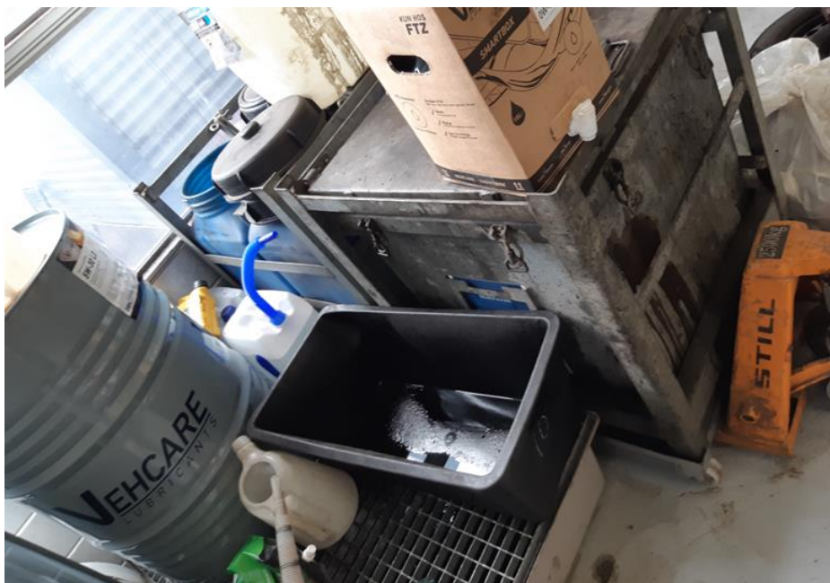
Rullebeholdere fra Abas – forrest firkantet beholder til oliefiltere. Bagved ses Rullevogn med 4 beholdere til kølevæske, sprayflasker m.m.