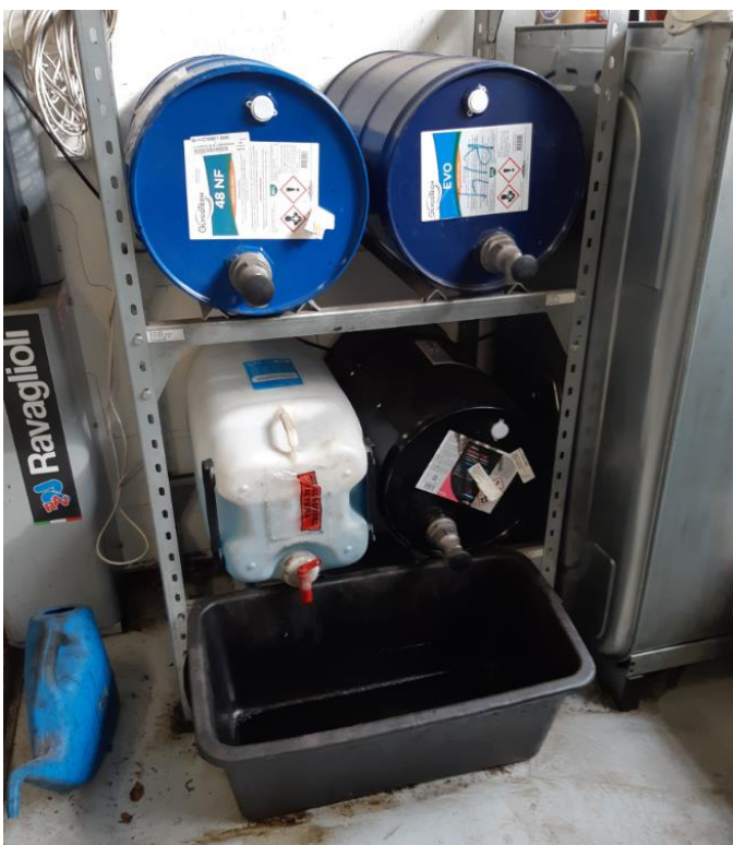
Ny olie og kemivarer på reol med spildbakke under aftapning.