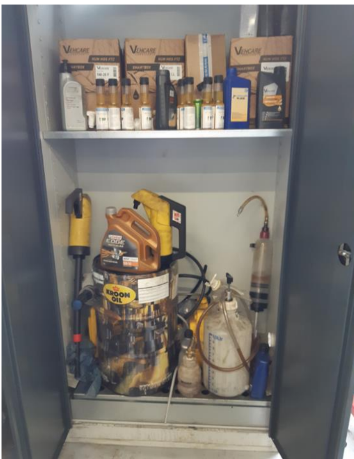
Ny kemi i kemiskab med spildbakke indbygget i bunden.