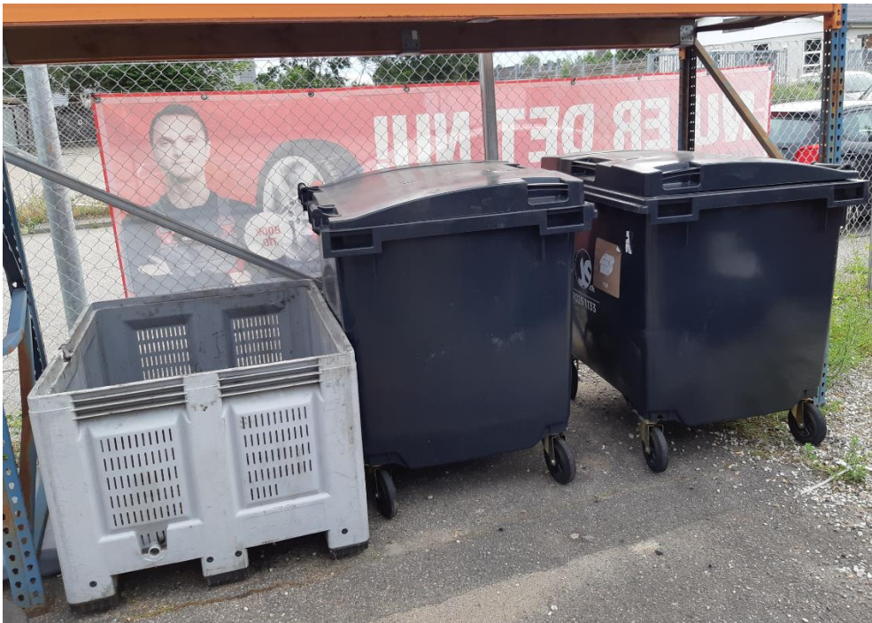
Grå kasse til metalaffald. En container til restaffald og en container til papaffald.