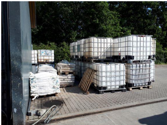
Tomme pallettanke udendørs.