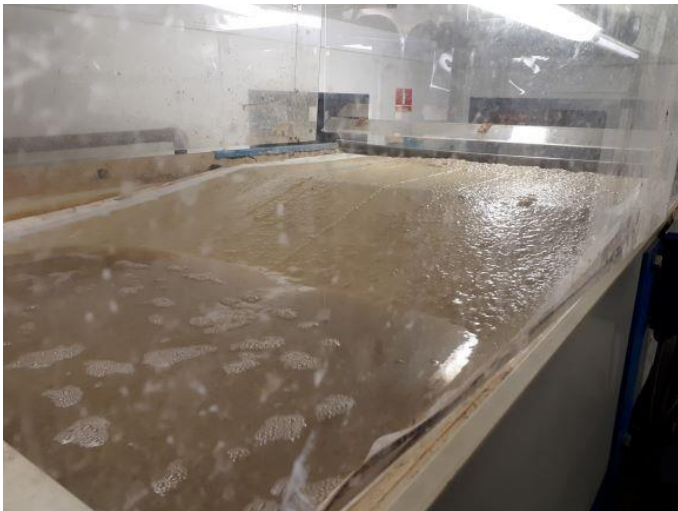
Filtrering af slam