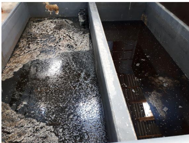
Modtagekar 2 og 3 med olie, som skimmes af.