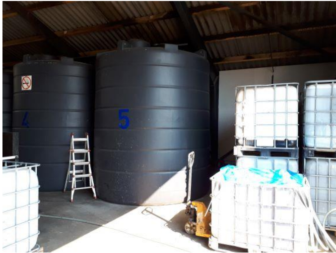
Beholdertanke og tomme pallettanke