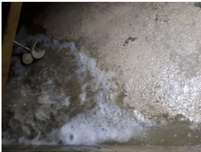
Tilførsel af olieholdigt spildevand til behandlingskar.