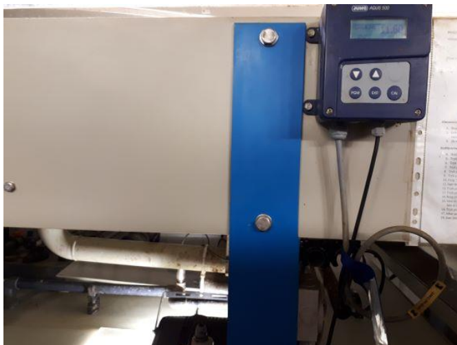
pH-måler til behandlingskar