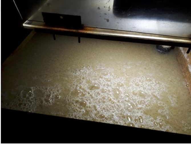
Flokkulering af spildevandet