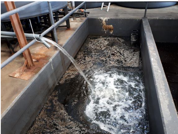
Renset spildevand (vandstråle)