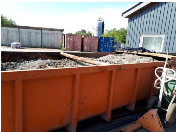
Container med jord og grus