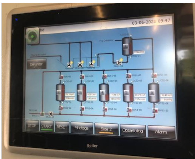
Oplag af olie/vand i tanke ca. 66 m 3