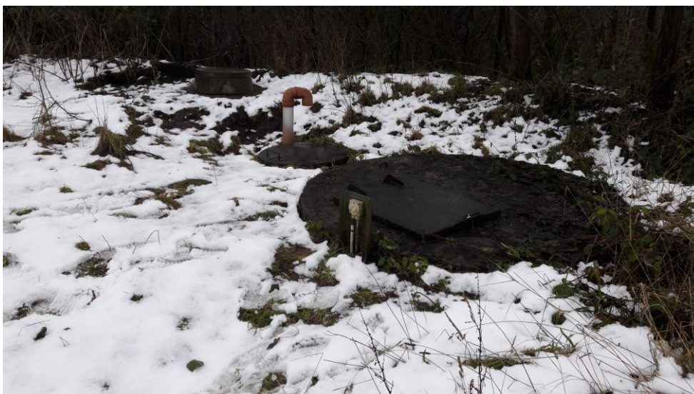
Figur 9. Perkolatsamlebrønd og pumpebrønd 2 til perkolat.