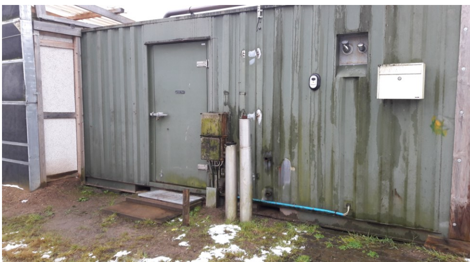
Figur 5. Påfyldningsstuds til diesel til kombimotor.