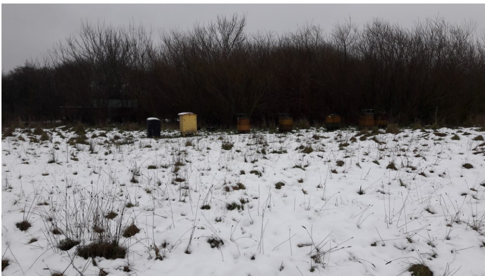
Figur 2. Deponiet er slutafdækket og tilvokset med vegetation

Deponiet skal derfor snarest og senest ved først kommende kursus i 2018 sikre, at driftslederen erhverver A-bevis for driftsledere.