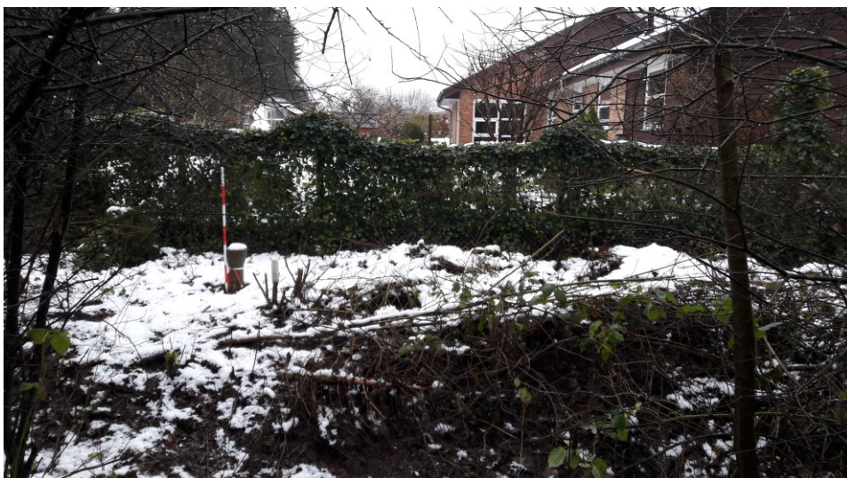
Figur 7. Gasmoniteringsboring i deponiets nordøstlige hjørne nær beboelsen Dybdalvej 4b.