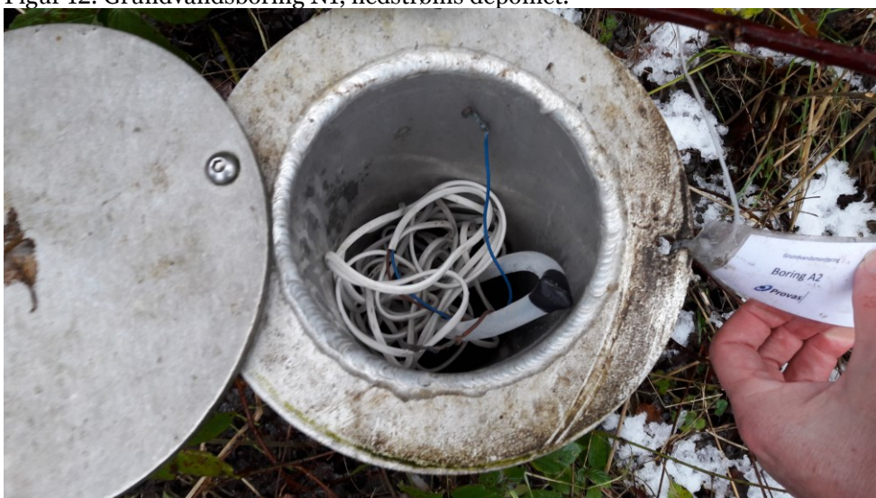
Figur 13. Grundvandsboring A2 nedstrøms deponiet