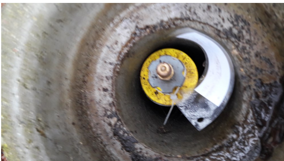
Figur 8. Gasmoniteringsboring med ventil.