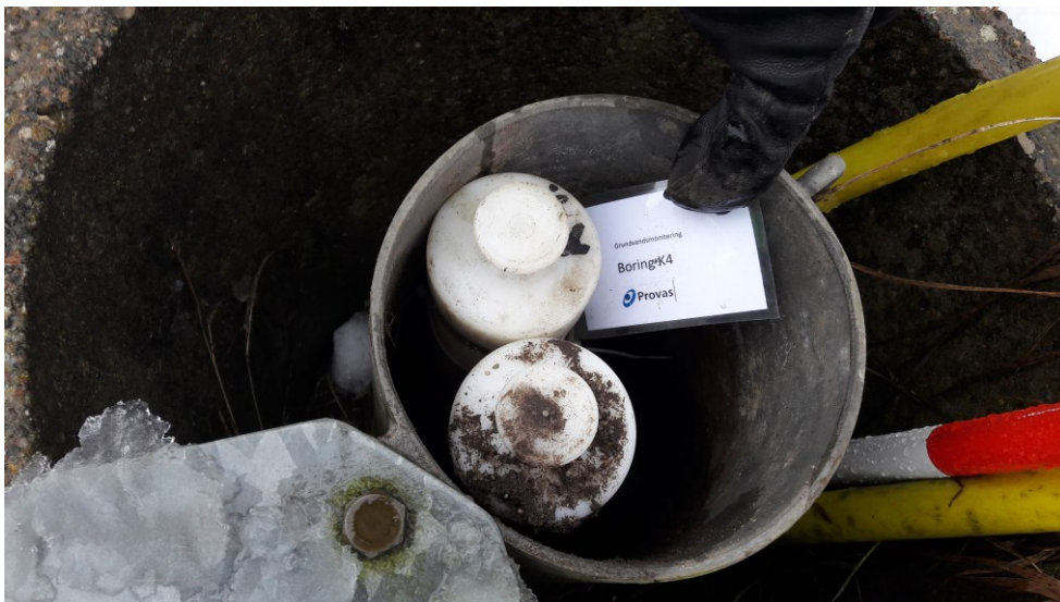
Figur 11. Brønd K4 opstrøms boring med 2 filterrør