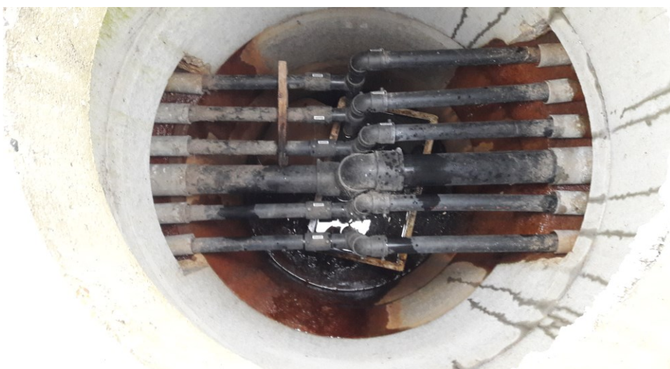
Figur 6. Åben gasfordelerbrønd hvor gasledninger fra hele deponiet samles inden det ledes til gasmotoren.