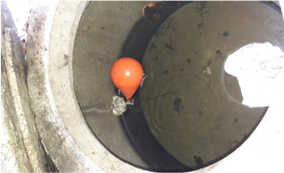
Figur 3. Overløbsbrønd for overfladevand ved nedsivningsanlæg langs omfangsgrøften i deponiets sydøstlige hjørne.

På deponiet er der etableret 2 nedsivningsanlæg til nedsivning af overfladevand på deponiarealer. Det ene anlæg i deponiets sydøstlige område blev forevist. Miljøstyrelsen har ingen bemærkninger.