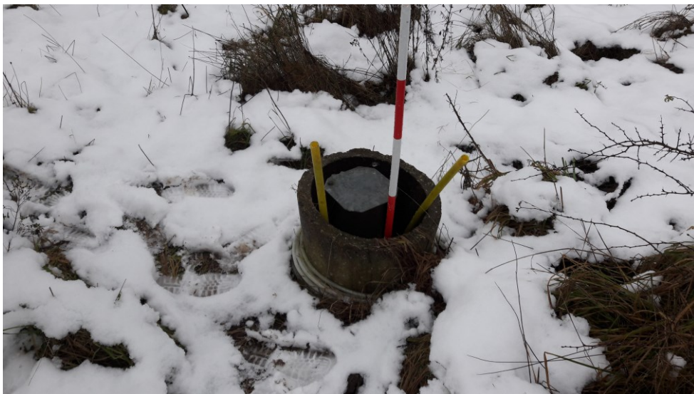
Figur 10. Brønd K4 opstrøms boring

Boring A1-A3, samt N1-N4 er ikke registreret i GEUS databasen. Det aftales at disse boringer registreres af Provas.