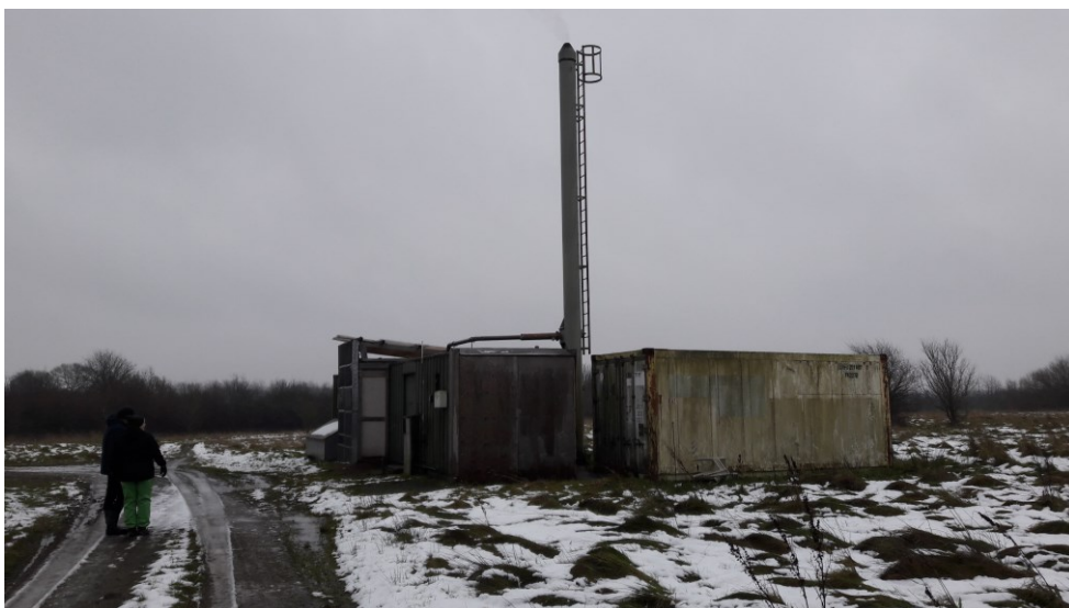
Figur 4. Gasmotorhus hvor deponigas afbrændes underproduktion af el til offentligt el-net.