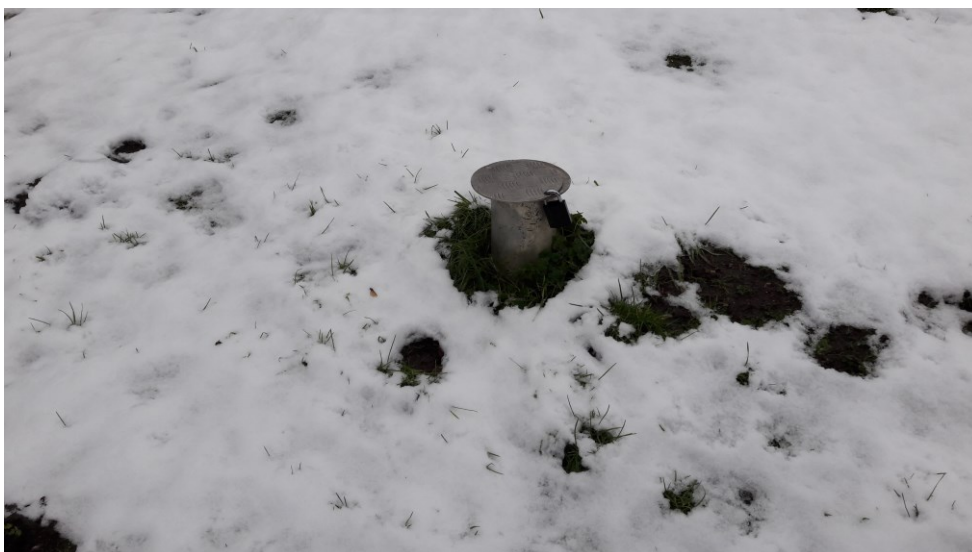
Figur 12. Grundvandsboring N1, nedstrøms deponiet.