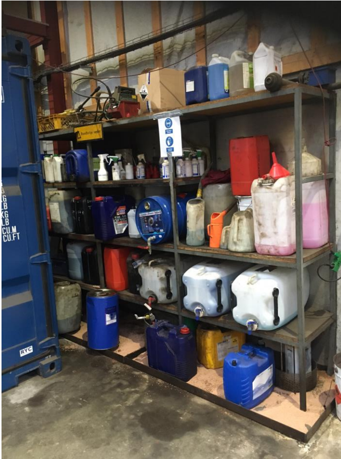
Billede 2. Opbevaring af kemikalier