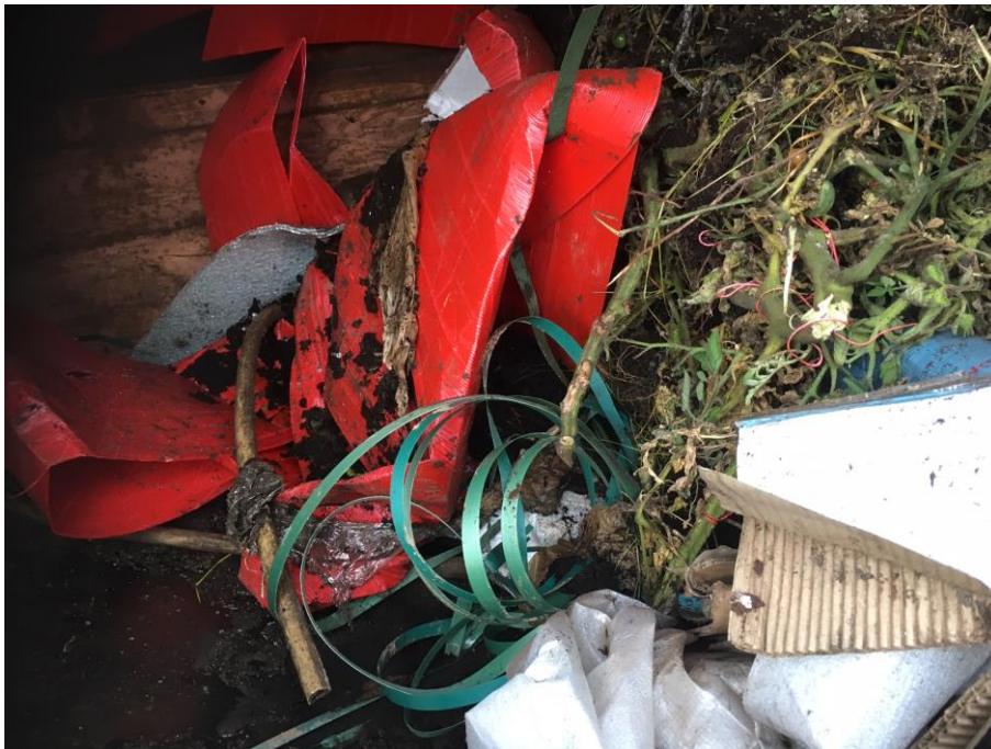
Billede 1. Opbevaring af forskellige former af erhvervsaffald i virksomhedens containere (plastic, træ, metal, pap, jord og haveaffald).