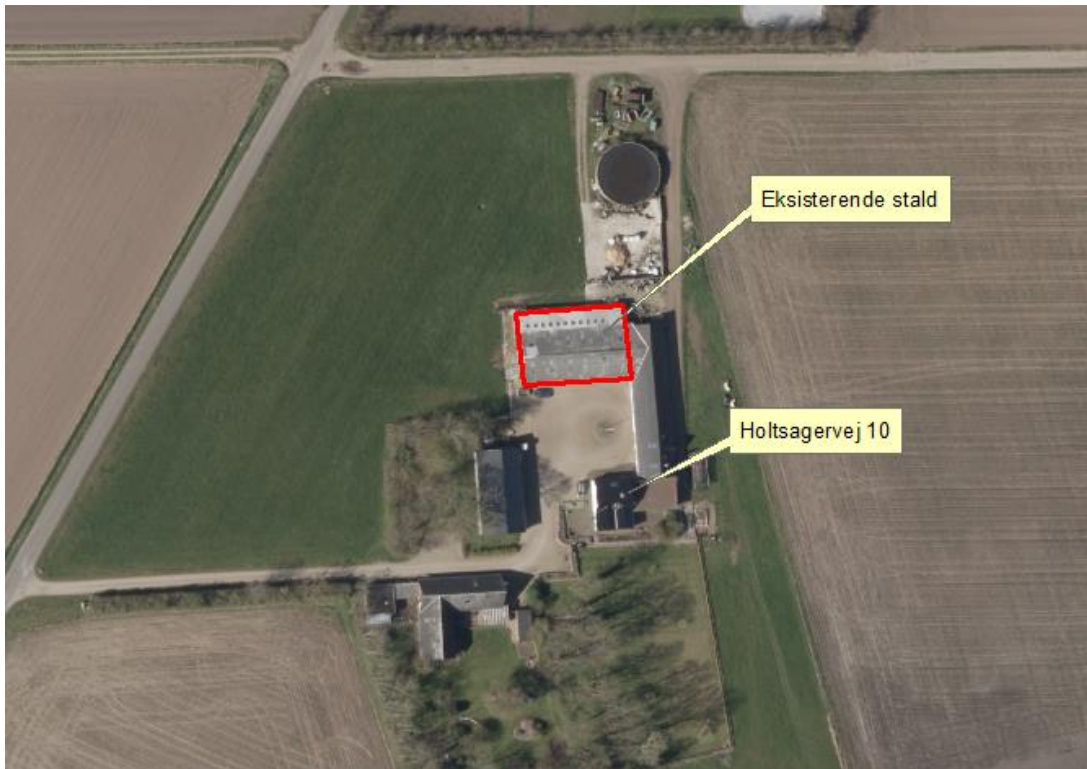
Kort 1. Udvidelse af dyrehold i eksisterende stald på Holtsagervej 10, 6771 Gredstedbro

Indretning af stalden og produktionsarealet er vist på kort 2.