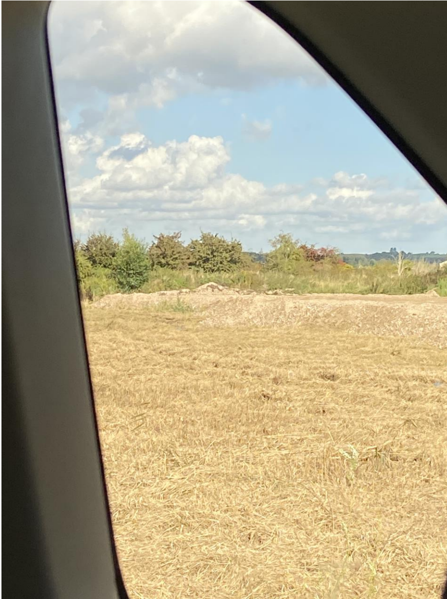
Figur 3 Deponikanten af etape F, hvor der sker deponering af asbest. Græsset for enden af deponikanten er slået og arealet er gjort klar til at få udlagt signalnet.

Deponiet må modtage jord til deponering. Deponiet har valgt at anvende det modtagne jord til deponering til daglig afdækning af asbesten, for på den måde at udnytte deponiets kapacitet bedst muligt.