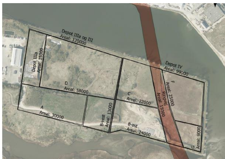
Figur 2 Ansøgt ændring af opdelingen af Horsens Deponeringsanlæg, som er i behandling hos Miljøstyrelsen. Deponiet administrerer efter den ansøgte inddeling mens sagsbehandlingen pågår, hvilket tilsynet har accepteret.