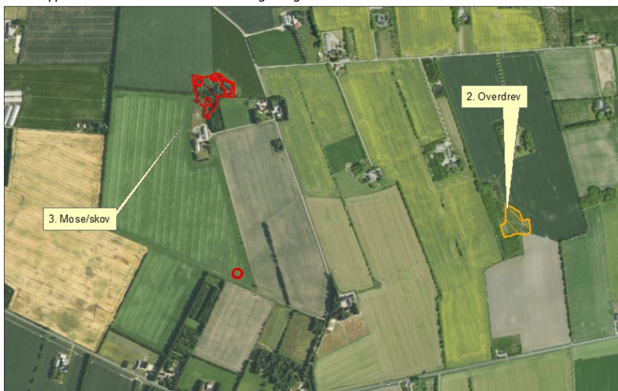
Figur 5. Kort over kategori 3 samt § 3 natur ved anlægget.

Naturtyperne er vist i nedenstående figur og tabel.