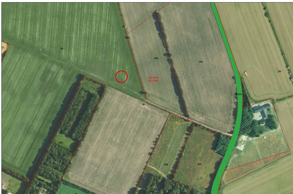
Figur 1. Placering af den ansøgte gyllebeholder.

Denne godkendelse omhandler kun gyllebeholderen, der er tidligere givet godkendelse til ejendommens andre bygninger.