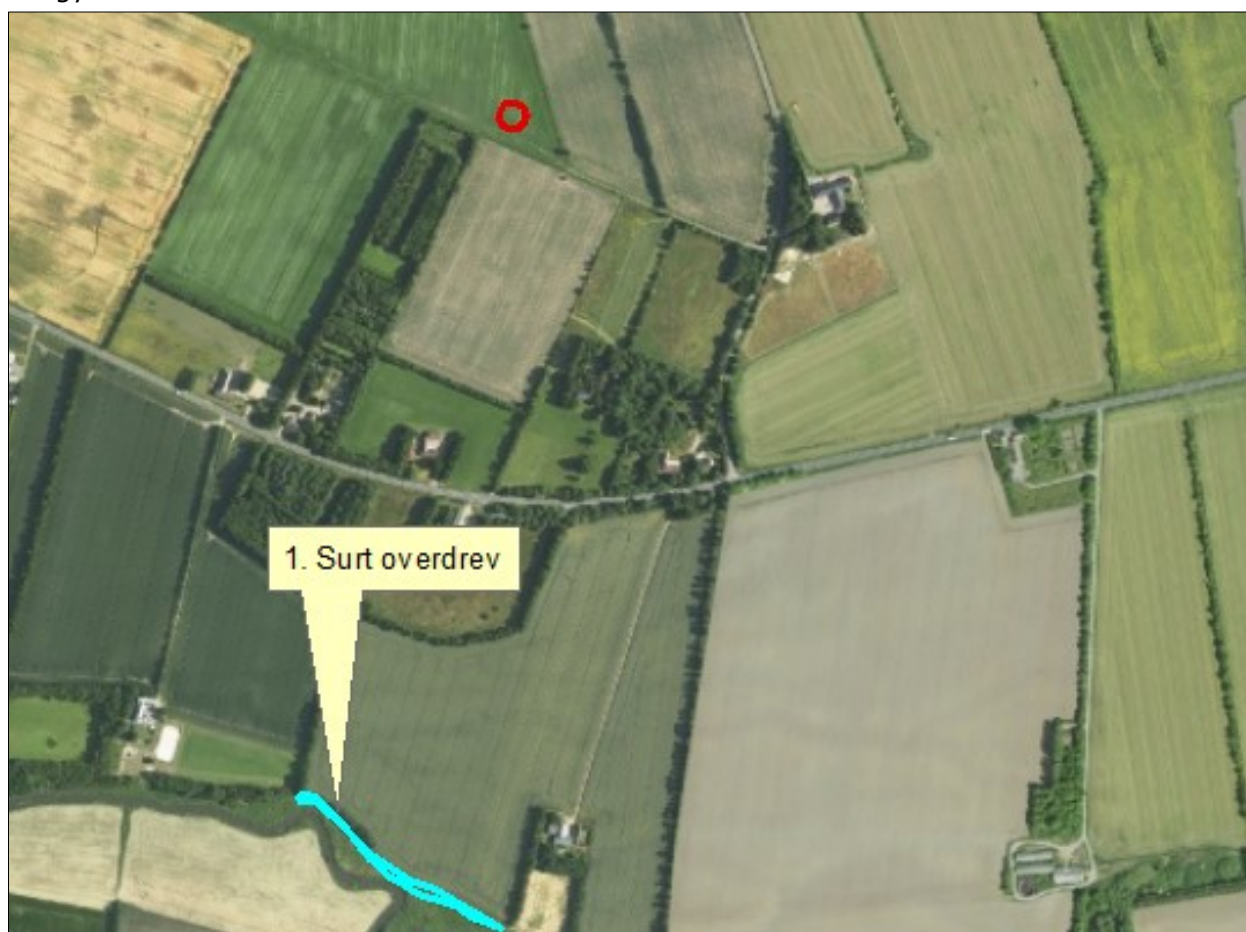
Figur 4. Kategori 1 naturområder ved anlægget.

Nærmeste Natura 2000-område nr. 91 (habitatområde nr. 80) – Kongeåen - ca. 800 m syd for gyllebeholderen.