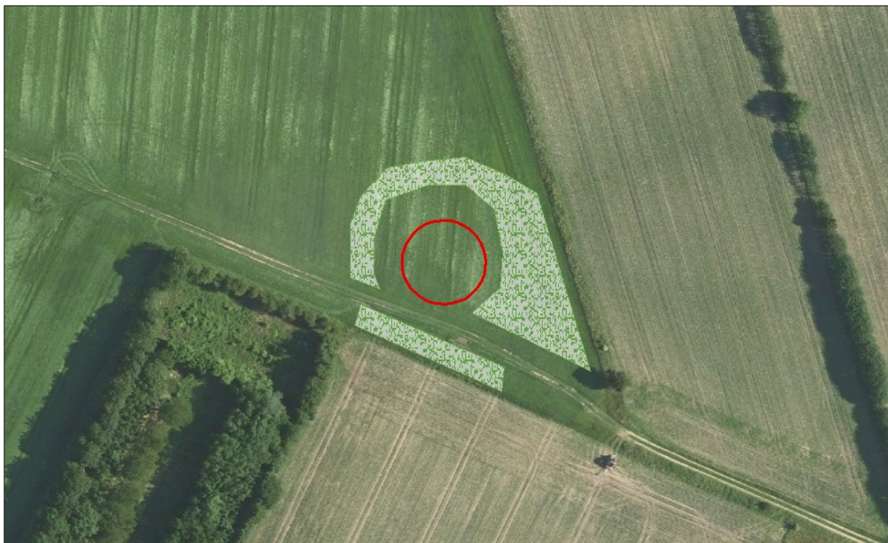
Figur 2. Beplantning ved gyllebeholderen.

For at skærme gyllebeholderen i landskabet og få den til at syne som en enhed med den beplantning/læhegn, der allerede er syd for beholderen, stilles der vilkår til beplantning rundt om gyllebeholderen. Forslag til beplantning er angivet i nedenstående figur.