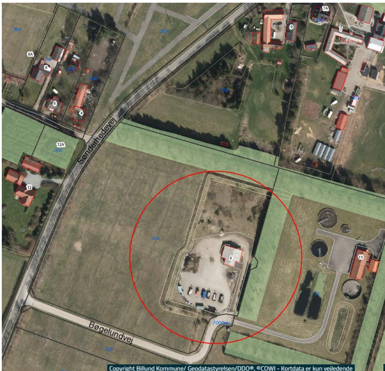
Figur 1 – placering af pladsen.

Arealet er beliggende i område med særlige drikkevands interesser.