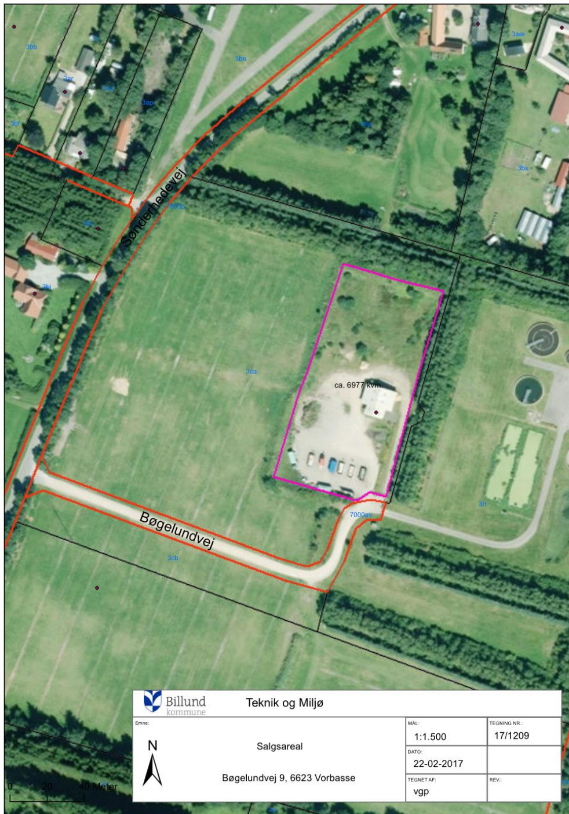
Figur 2: Placering af pladsen, målestok er ikke gældende.