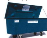
Aflang beholder (lån)