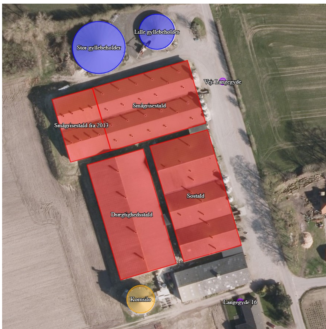
Figur 1: Anlægsoversigt Langegyde 16, 5631 Ebberup.

Der er søgt om ændret udnyttelse af produktionsarealet i eksisterende staldanlæg.