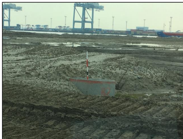
Foto af prøvebrønde på Oliehavnen.