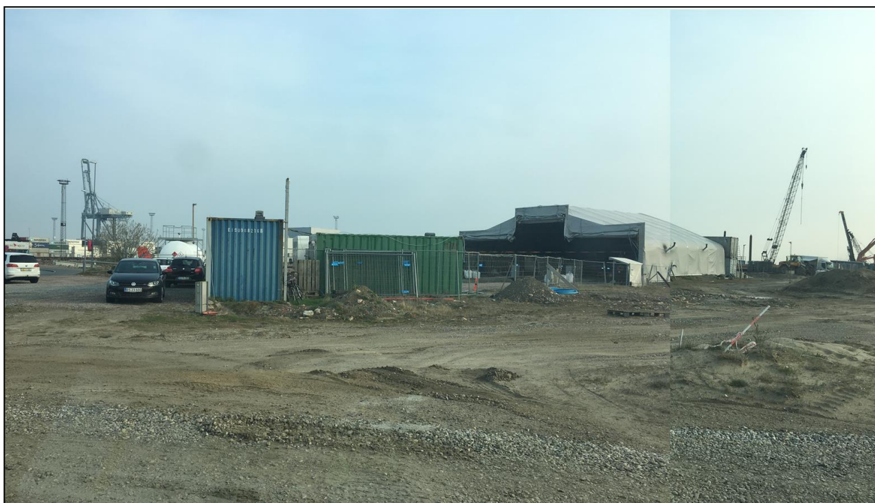
Foto af vandflyverens område taget fra byggeri-siden.

Kig ud mod bygge-anlægsarbejdet med den nye færgehavn på Miljøhavnen. Der er opsat skurvogne til områdets arbejdere og aktiviteter.