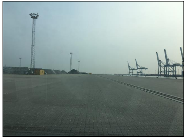
Foto ud mod molen, som er etableret på Oliehavnsens vestspids af jordtippen.