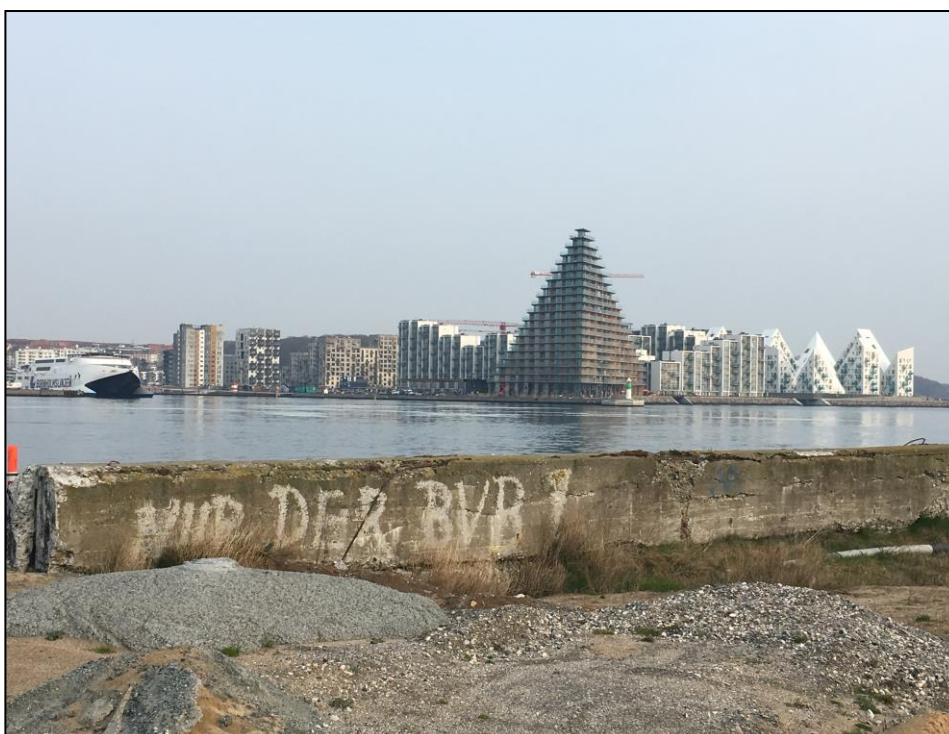
Foto af Aarhus Ø set fra Oliehavnens spids

Der er ingen påtalte forhold at følge op på.