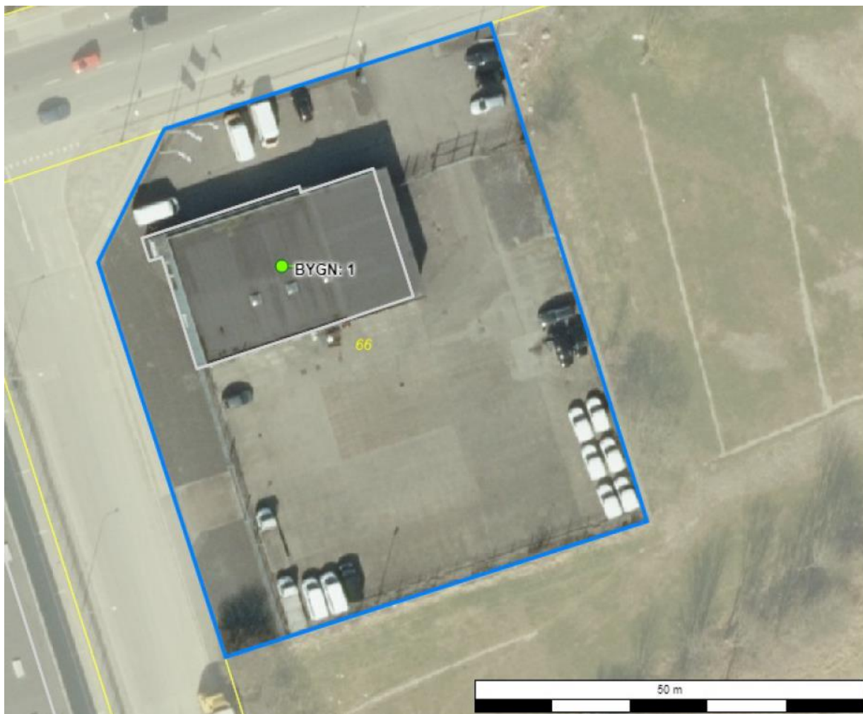
Luftfoto af virksomheden med matrikelskel

I forhold til kommuneplanen ligger virksomheden i område 160413ER, der er udlagt til erhverv. Området er omfattet af lokalplan 601. Ejendommen ligger i et byfornyelsesområde, der forventes omdannet til boligformål, når det nærliggende Åby Renseanlæg er nedlagt.