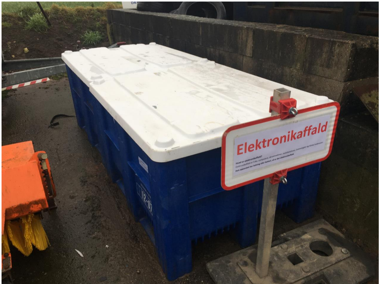
Billede 1. Elektronikskrot opbevares nu i disse lukkede beholdere.