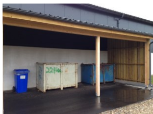
Udendørs oplag af affald