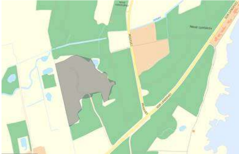
Figur 1 V2 kortlagt område i Nexø lystskov