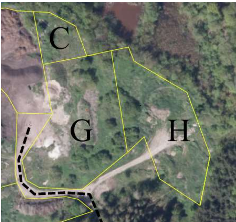
Figur 2. Kort over projektområdet i Nexø lystskov.