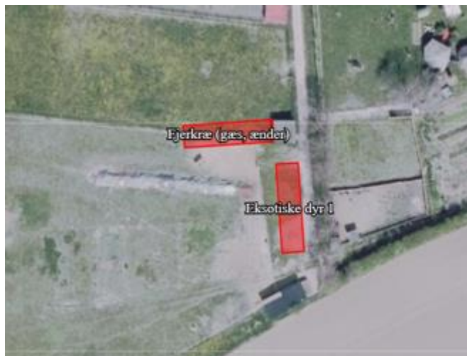
Foto 2. Placering af fjerkræbygning i stedet for A4 læskur

Stalden opføres i samme materialer som ny bygning. Ændringen af projektet foregår 287 m fra nærmeste nabobeboelse.