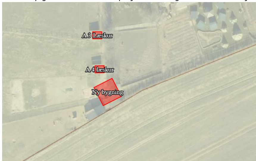
Foto 1. A4 læskur a 16 m 2 nedrives og erstattes af 66 m 2 produktionsareal til fjerkræ.

Slagelse Kommune, Miljø og Natur har den 11. april 2024 modtaget en ansøgning nr. 244993 via husdyrgodkendelse.dk om projektilretninger i forhold til miljøtilladelse af 3. marts 2022.