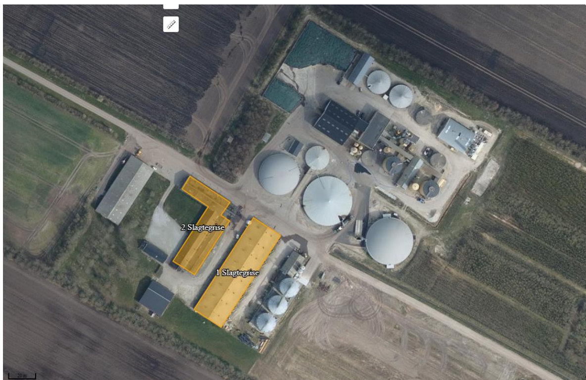
Luftfoto, der viser beliggenheden af de stalde, hvor slagtesvineproduktionen foregår på Vildmosevej 21.