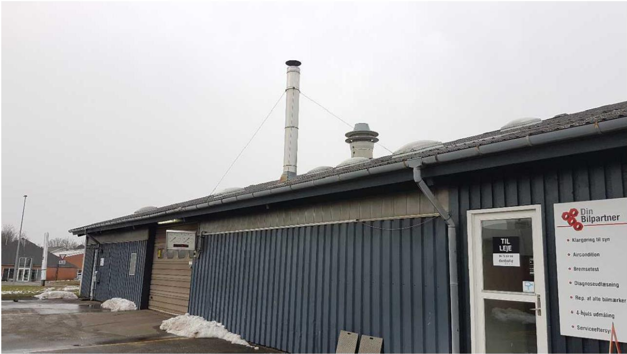
Skorsten fra oliefyringsanlæg.