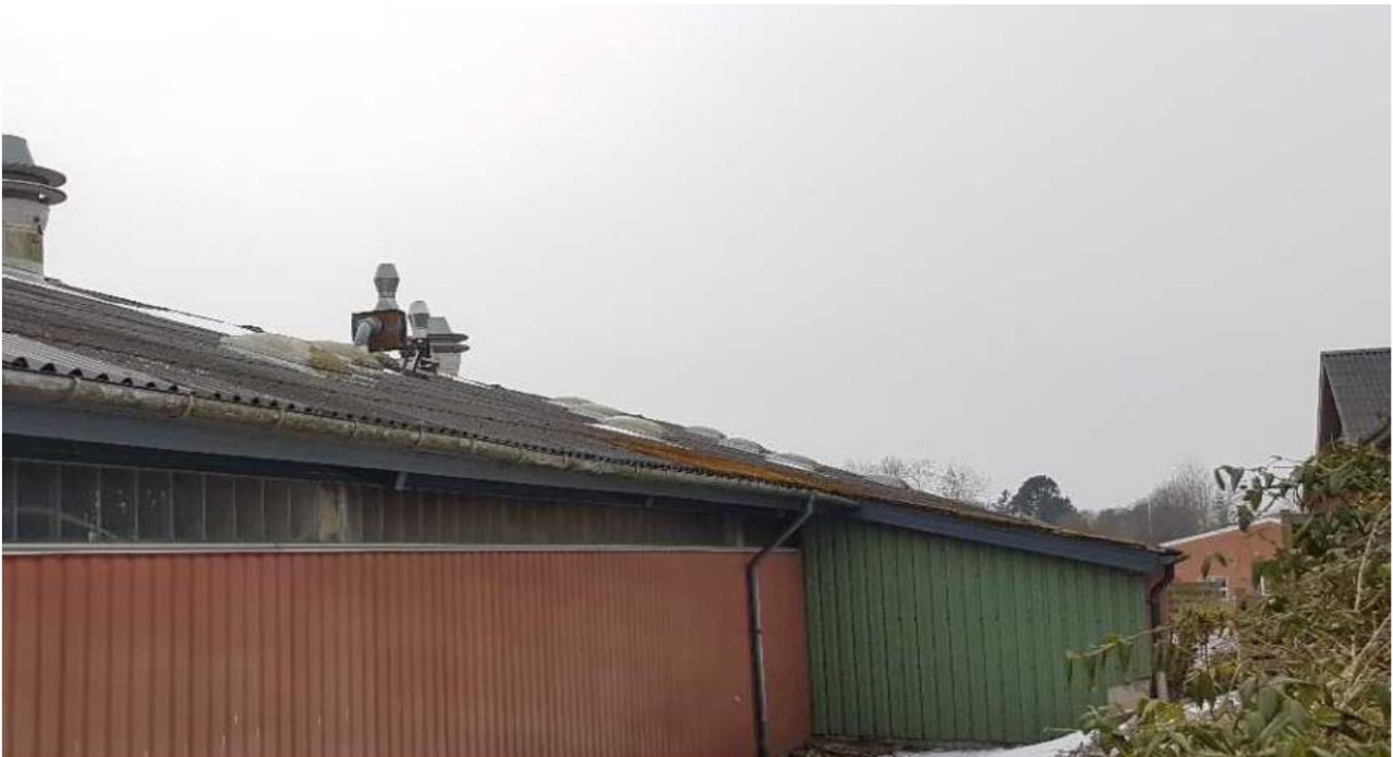
To afkast til henholdsvis udstødningsgas og svejserøg.