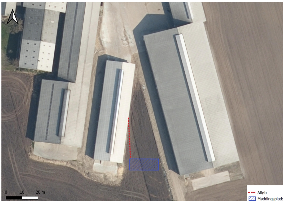
Kort 2: Ny ansøgt placering af møddingen.