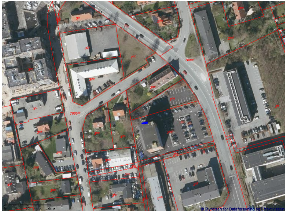
Figur 1. Kortudsnit af området ved bygning 8Y, hvor køleanlægget placeres i nordenden. Placeringen er markeret med en blå prik (omtrentlig).

et tilsvarende køleanlæg i bygningens kælder. I har i ansøgningen beskrevet, at støjniveauet for anlægget i 1 m afstand er L_p=53 dB(A), som svarer til et lydeffektniveau på ca. LW=68 dB(A), og at støjbidraget fra chilleren derfor vil blive L_p=31,7 dB(A) i nærmeste skel, hvilket betyder, at den samlede støj fra Novo Nordisk vil blive 35,2 dB(A) i nærmeste skel.