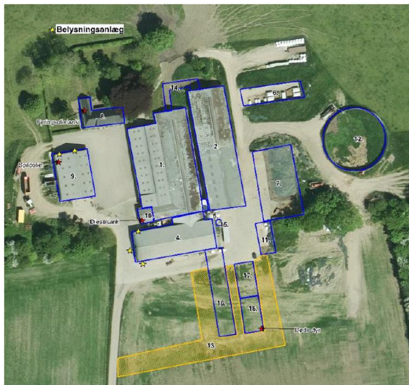
Figur 3: Placering af oiletanke, spildolie, døde dyr og belysningsanlæg. Den nye silo har nr. 15 på figuren.