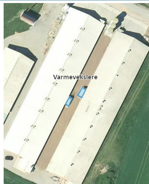
Figur 2. Varmevekslere.

På samme vis vurderes det, at monteringen af varmeveksler ikke har medført en forøgelse af støjmissionen. Støj fra varmevekslerne er ikke væsentlig i forhold til de andre støjklender på ejendommen.