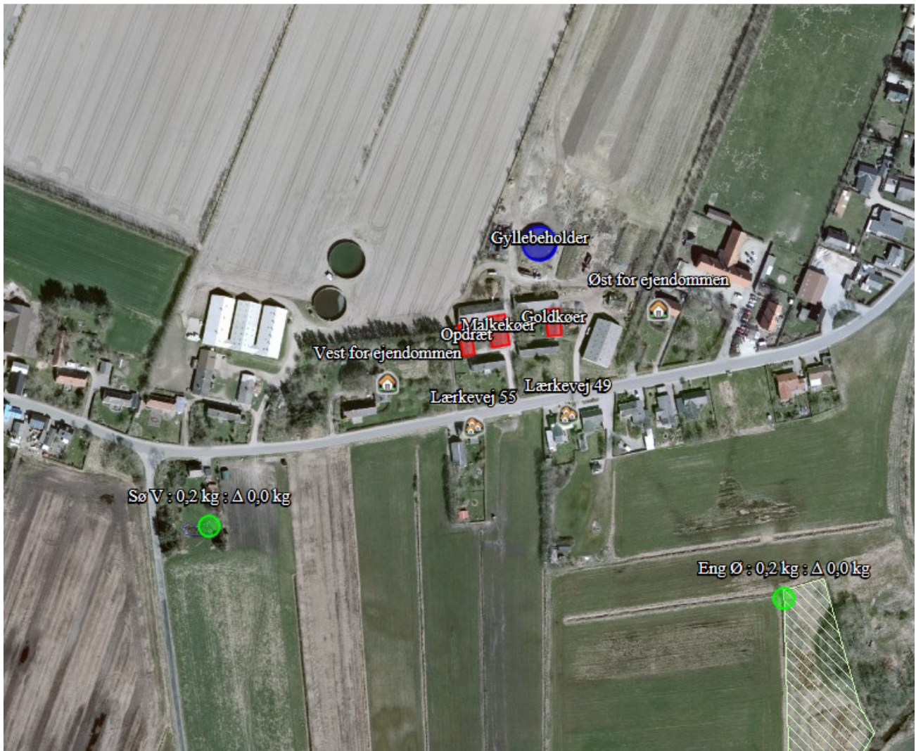
Figur 2. Naturpunkterne

Ifølge Miljøstyrelsens digitale vejledning vil en merbelastning på mindre end 1 kg N/ha/år som udgangspunkt ikke udgøre et væsentligt merbidrag, og det kan derfor ikke medføre tilstandsændringer af kategori 3-natur og § 3-områder. Da merbelastningen ikke overskrides til de nærmeste naturarealer, vurderes merbelastningen heller ikke at overskrides til naturarealer, som ligger længere væk (tabel 3). Vurderingen er lavet ud fra det videnskabelige grundlag og kendskabet til de pågældende naturtyper, der i øjeblikket er tilgængelig.