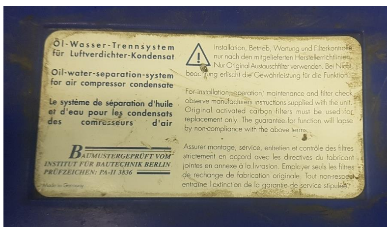
Etikette på olieudskilleranlægget