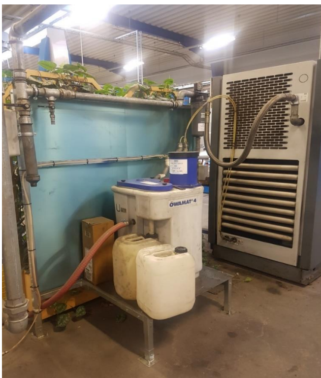
Kompressor med olieudskilleranlæg