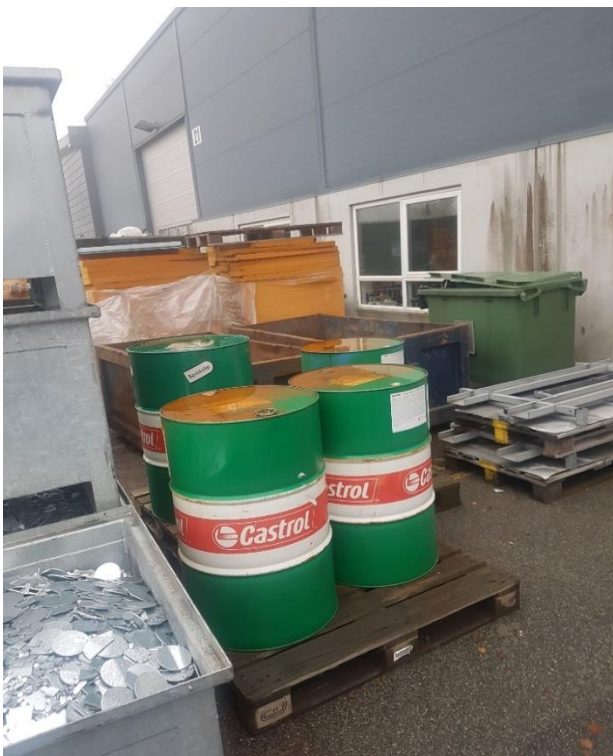
Opbevaring af flydende farligt affald er ikke i overensstemmelse med gældende forskrift