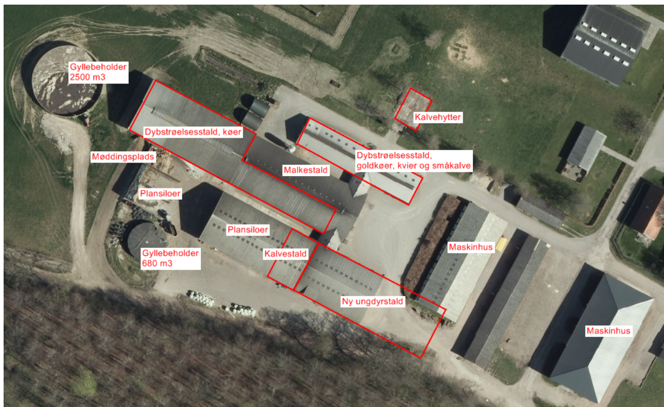
Figur 4.1. Oversigtskort over husdyrbrugets anlæg.