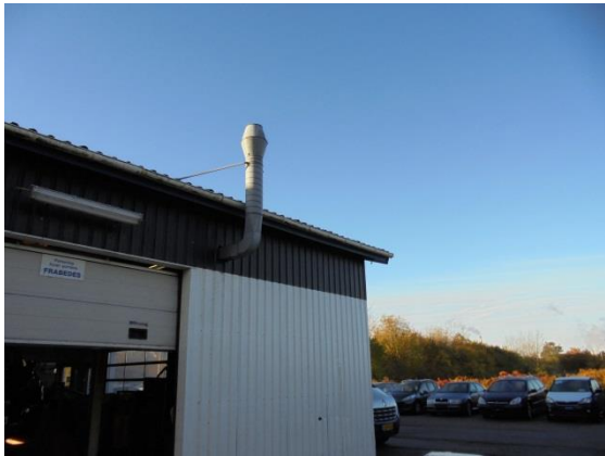
Afkast fra udsugning fra værkstedet

I værkstedet er der punktudsugninger fra udstødning. De ledes alle til fælles afkast, der er ført over tag. Der er svejseudsugning fra pladeværkstedet, der føres gennem filter og videre til afkast over tag.