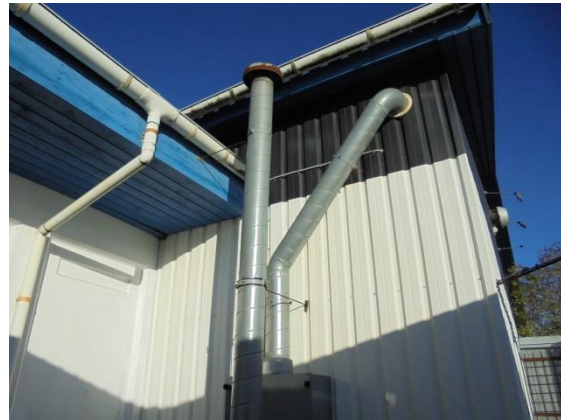
Afkast fra svejseudsugning fra pladeværkstedet

Virksomheden har tidligere været opvarmet med oliefyr, men har i dag fjernvarme.