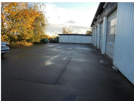
Dæksler til sandfang og olieudskiller

Under tilsynet blev der fremvist dokumentation for den seneste tømning af sandfang og olieudskiller. Der blev foretaget af Vestlollands kloakservice 01-02-2016.