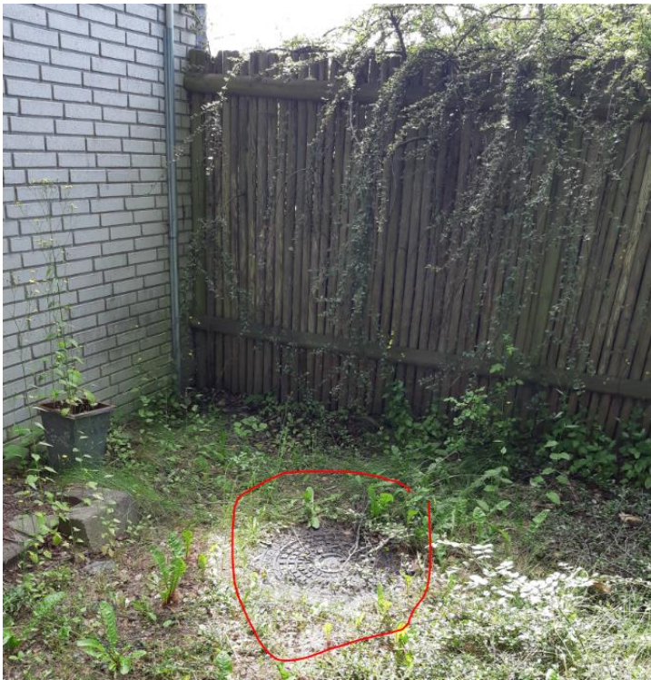
Dæksel til olieudskiller