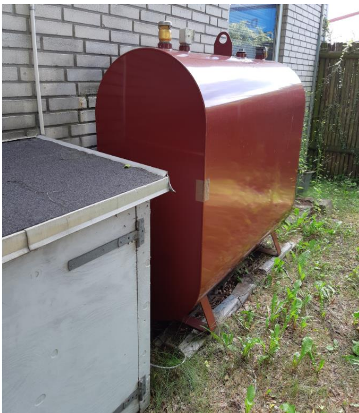
Afskærmet kompressor tilhører Q8's vaskehal. Fyringsolietank til værkstedet.

På www.helsingor.dk/databeskyttelse finder du oplysninger om, hvordan kommunen behandler personoplysninger samt kontaktoplysninger på vores databeskyttelsesrådgiver.