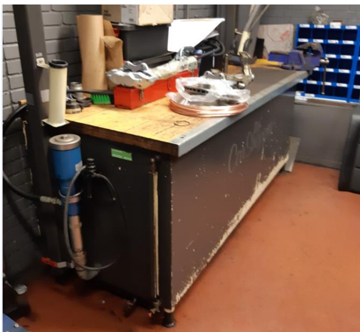
"bordtank" til spildolie