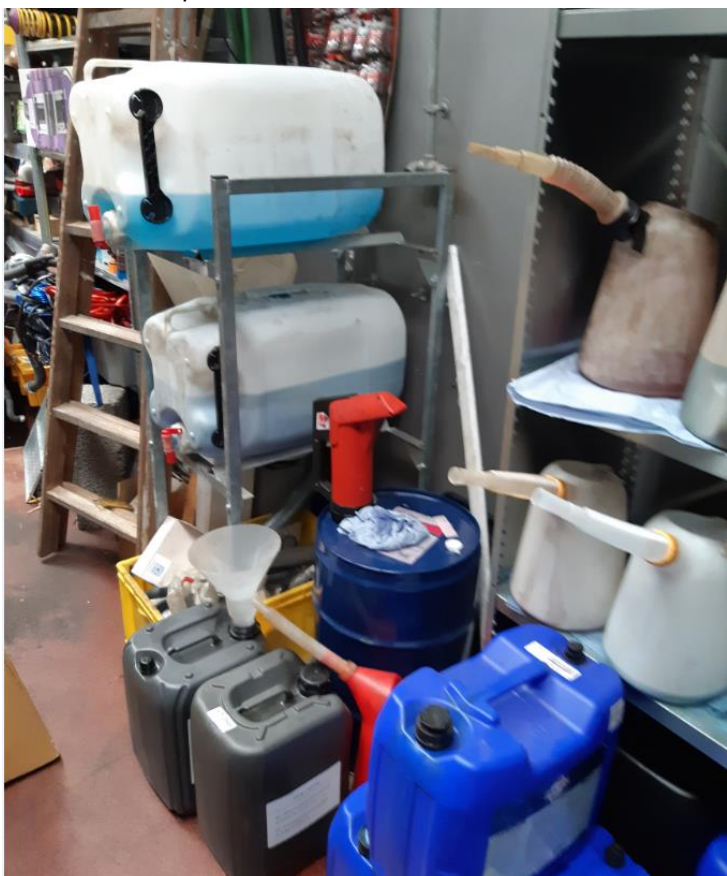
Ny olie og kemi i lokale indendørs