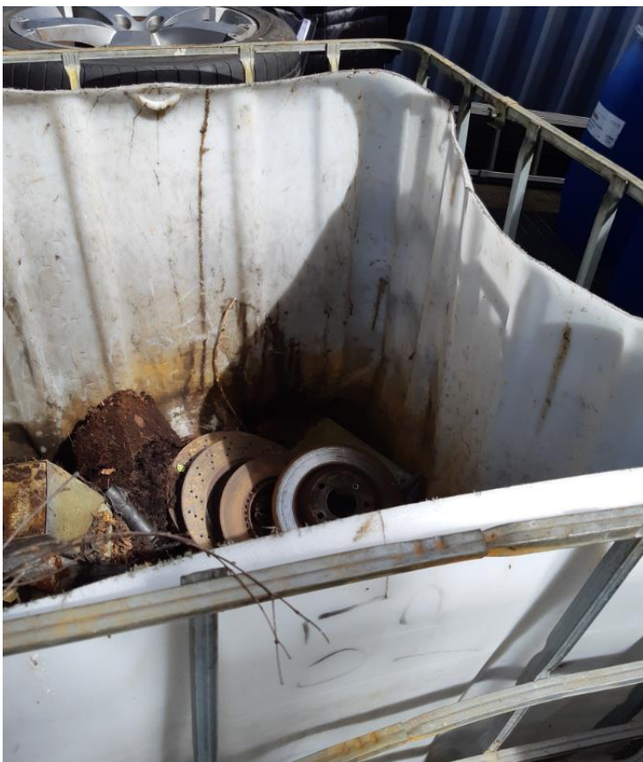
Palletank til metalaffald