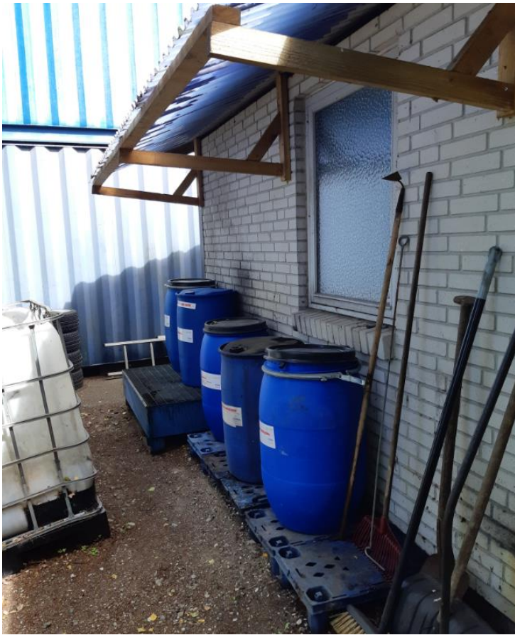
Oplag af kemikalieaffald – palletanken til venstre er til metalaffald