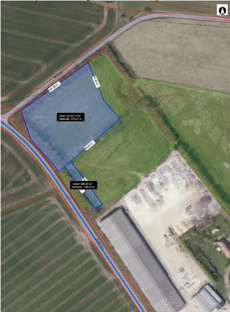
Figur 2; Område til ny oplagsplads samt adgangsvej igennem § 3 område. Kort fra landzonetilladelsen.

Engen er en relativ tør eng, som har den laveste værdi- og målsætning i Varde Kommunes naturkvalitetsplan. Den berørte del af engen var præget af rajgræs, og der var ikke fundet særlige arter i denne del af engen. Baggrunden for etablering af vejen er at undgå trafik på offentlig vej, når der skal køres imellem de to oplagspladser. På denne baggrund har Varde kommune meddelt dispensation fra naturbeskyttelseslovens §3 til forbindelsesvejen i 2019.