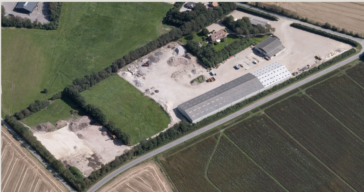
Skråfoto - indeholder data fra Styrelsen for Dataforsyning og Effektivisering, Kort 8, august 2019