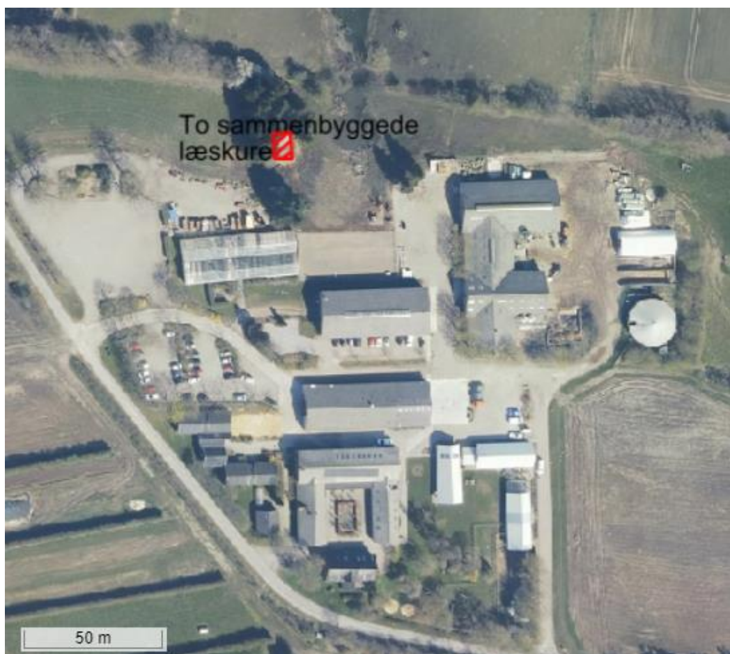
Oversigtsplan med angivelse af placering af to læskure. Nyeste læskure opført 2020-21.