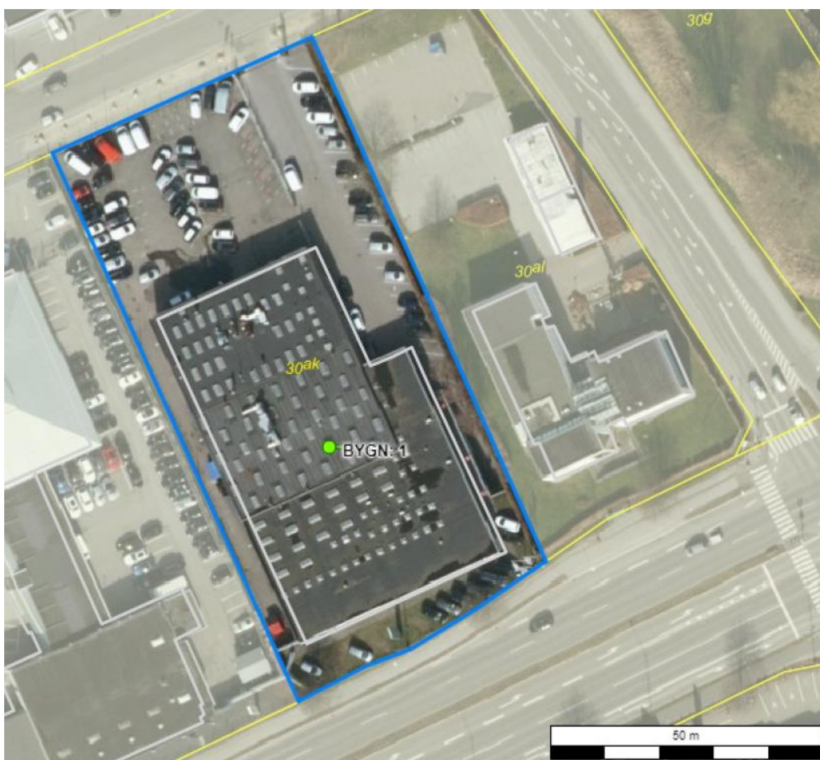
Luftfoto af virksomheden med matrikelskel

I forhold til kommuneplanen ligger virksomheden i område 150803ER, der er udlagt til erhvervsformål. Området er desuden omfattet af byplanvedtægt V-R 3. Der kan etableres en bolig i tilknytning til den enkelte virksomhed. Nærmeste boliger ligger i en afstand af ca. 40 meter syd for virksomheden på den modsatte side af Grenåvej.