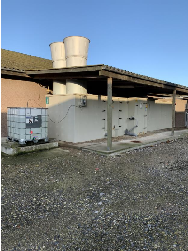
Anlægget til bortrensning af ammoniak.