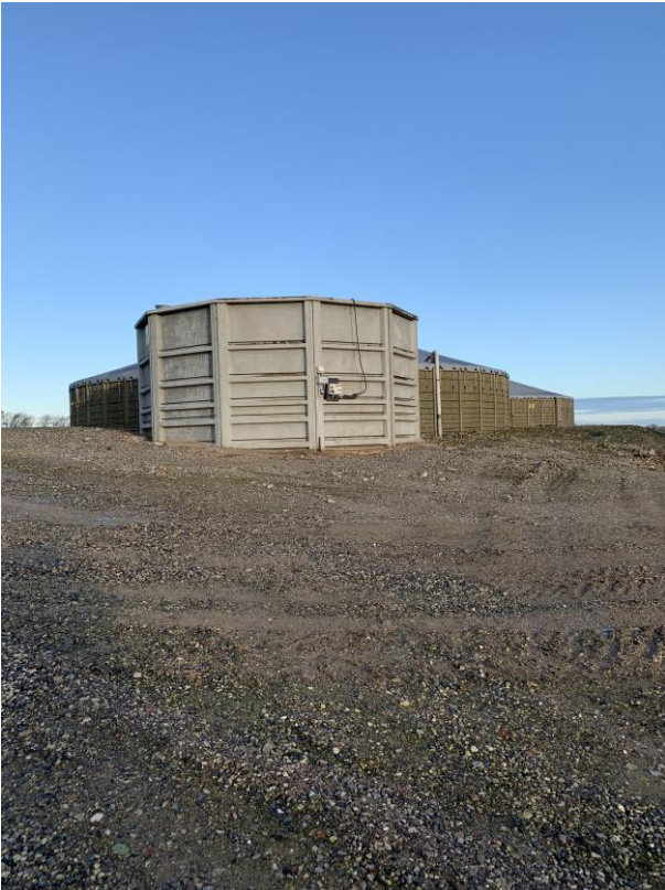
Ny afhentningsbeholder (gylle til biogasanlæg).