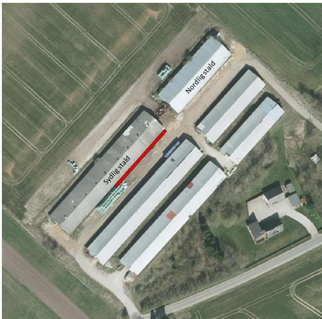
Situationsplan over Favrskovvej 8B. Foderbordet er markeret med rødt.