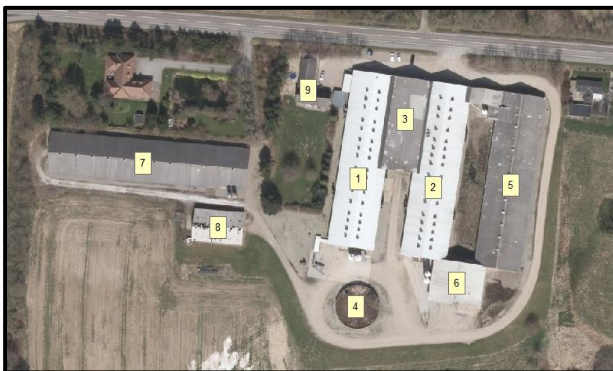
Figur 1. Oversigt over husdyrbrugets bygninger.

Oversigt over husdyrbrugets bygninger fremgår af figur 1.