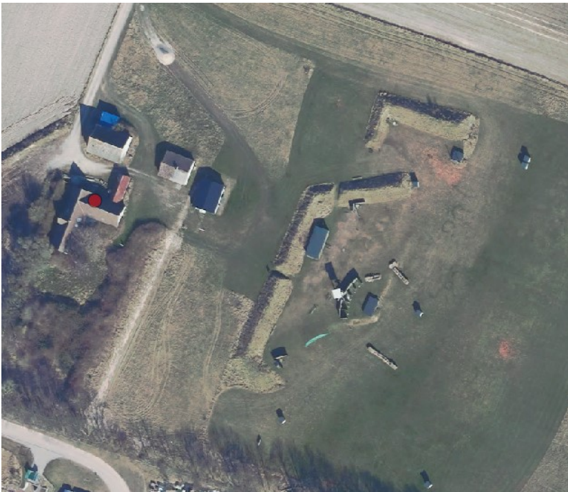
Kortudsnit fra flugtskydningsbanen 2022

Skydebanen ligger inde for områder med drikkevandsinteresser (OD).